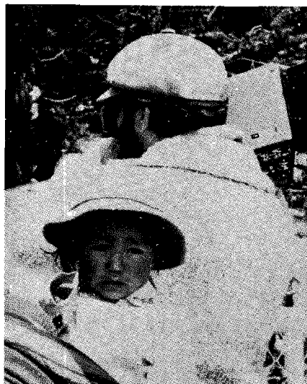
"materiales concordantes con las manifestaciones culturales de América Latina y el Caribe.

Esta doble perspectiva supone para la ALASEI criterios de selección y de tratamiento adecuado en la elaboración de sus materiales tomando en cuenta la audiencia a la cual se dirige. En cuanto