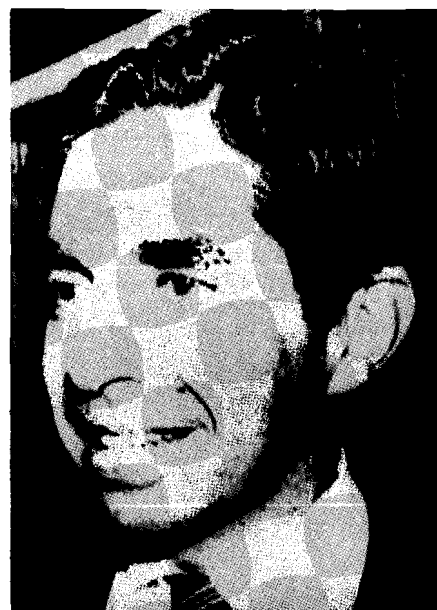
Oscar Arias: el Estado no puede seguir creciendo al ritmo que creció en el pasado

En el plano de lo externo, esta solución de compromiso se refleja en la proclama de neutralidad lanzada en