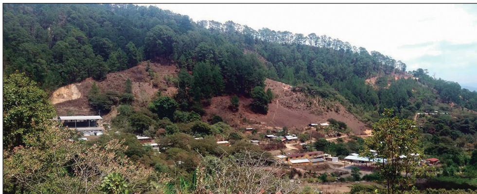
Imagen 1. Vista de Xochiatenco, comunidad me'phaa

Entre las décadas de 1970 y 1980, a unos kilómetros de Xochiatenco, en Barranca Panal, se instaló una minera artesanal con inversión de un grupo de acapulqueños, quienes luego la cedieron a una transnacional canadiense. Campesinos del lugar sustituyeron la actividad agrícola por la mina; los hombres laboraban como obreros y las mujeres abastecían de alimentos. Las consecuencias de la minera fueron la dependencia de sus salarios y enfermedades causadas por químicos altamente tóxicos.