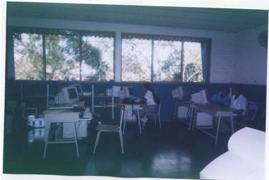
Centro de cómputo en San Sebastián equipado con donaciones de la Asociación Bataneca de San Francisco y Comité de Residentes Batanecos de Los Ángeles.