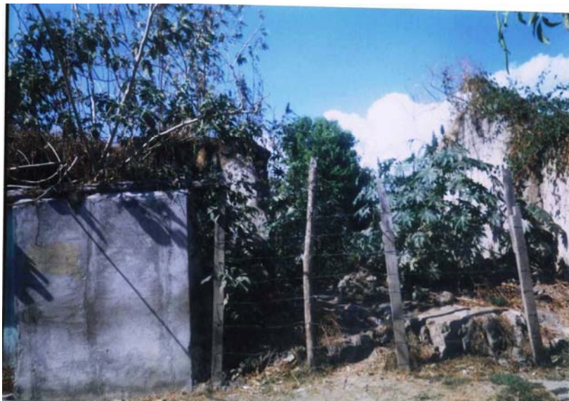
Terreno para construir la Cruz Roja de San Sebastián. Comprado con donaciones de la Asociación Bataneca de San Francisco y Comité de Residentes Batanecos de Los Ángeles.