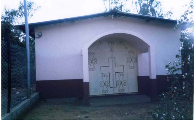
Ermita Vista Hermosa. Mercedes Umaña. Construida con donaciones de migrantes residentes en Houston y Virginia