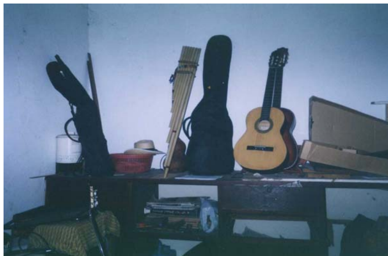
Instrumentos musicales donados a la Casa de la Cultura de San Sebastián, por Comité de Residentes Batanecos de Los Ángeles.