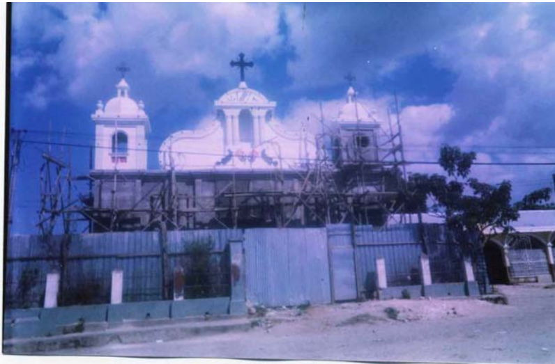
Mejoras a la Parroquia Central de San Sebastián., realizadas con donaciones de migrante individual residente en Alabama.