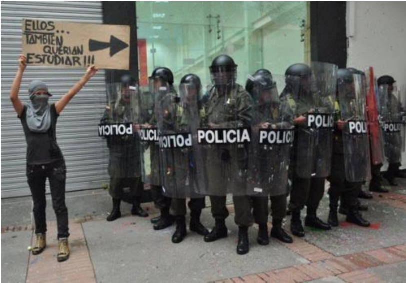
Figura 3.3. Jornada de movilización Abrazatón por la universidad