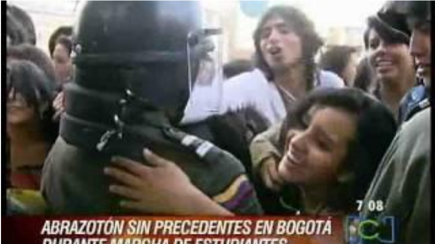
Figura 3.2 Jornada de movilización Abrazatón por la universidad.