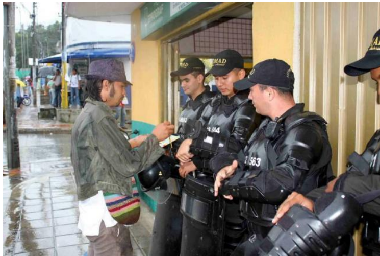
Figura 3.4. Jornada de movilización nacional Abrazaton por la universidad