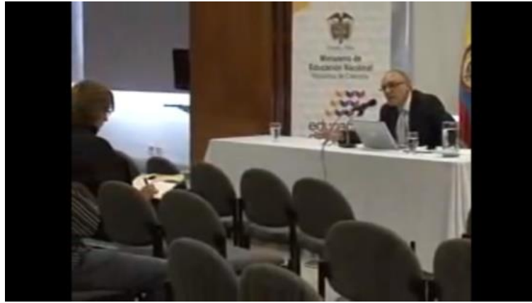
Figura 3.5. Mesa de Dialogo MEN y estudiantes en Bogotá