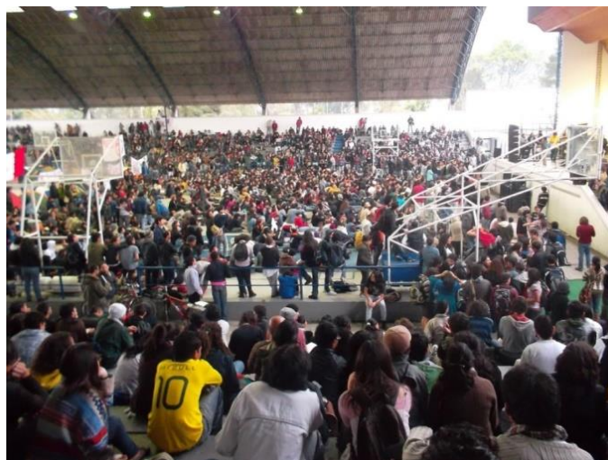
Figura 3.6. Plenaria cancha acústica Universidad Nacional 12 de noviembre de 2011