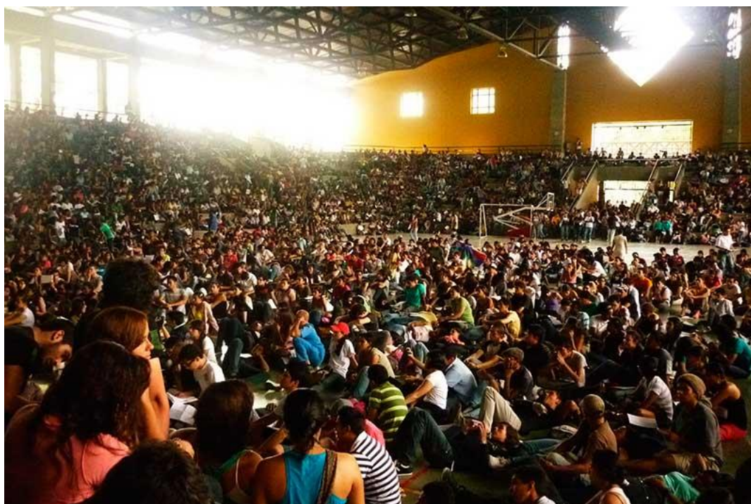
Figura 3.1 Asamblea Triestamentaria Universidad del Valle