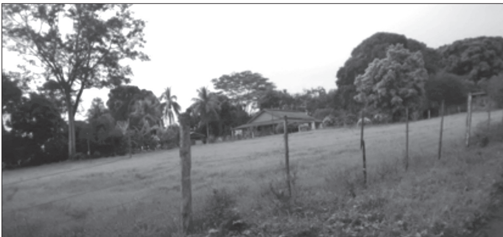
Figura 5. Ambiente rural consorciando pastagem, pomar e árvores nativas