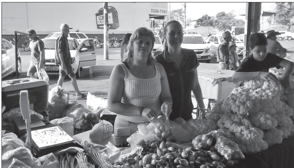
Figura 3. Banca de produtos disponíveis para venda na feira

Feira Municipal na cidade de Tangará da Serra, 2016.