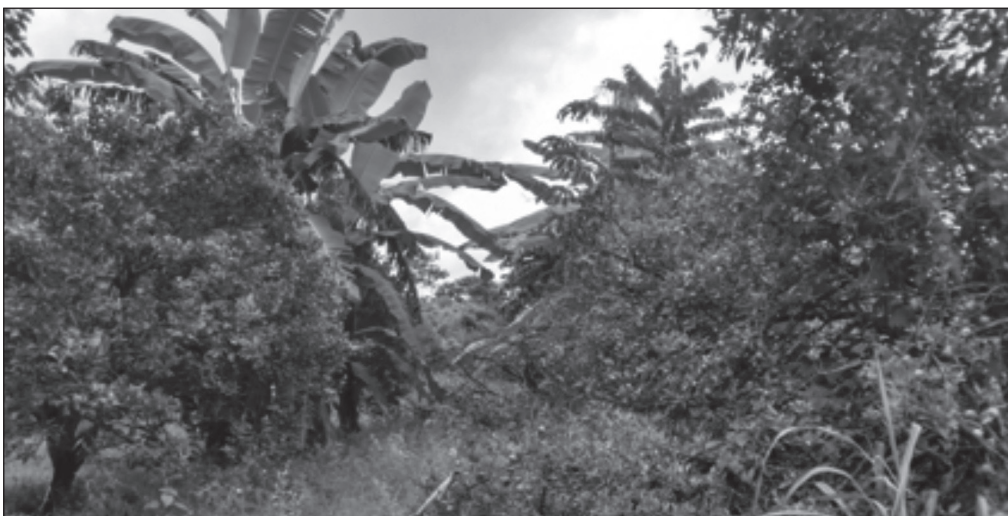
Figura 6. Lavoura consorciada: frutas cítricas e bananeiras em ambiente da natureza

Fonte: Foto de José Pereira Filho, Santo Antônio, comunidade Córrego das Pedras, 2017.