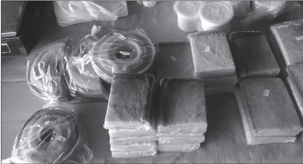
Figura 4. Banca de produtos transformados artesanalmente, disponíveis para venda na feira

Fonte: Foto de Jose Pereira Filho, Feira Municipal na cidade de Tangará da Serra, 2016.