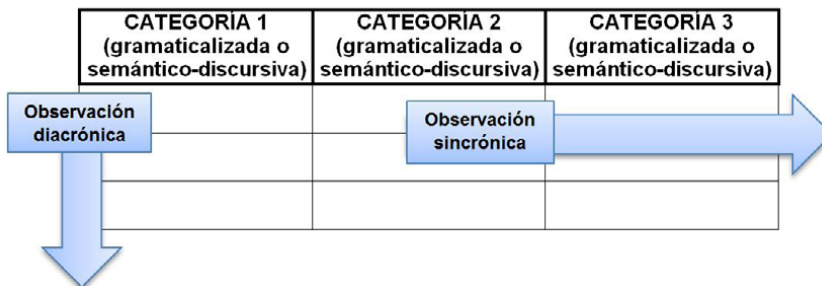
Imagen 1. Esquematización del MSDALT y doble observación

torias. Luego se buscan las categorías semántico-discursivas. Finalmente, cada una de las emisiones se analiza de igual modo, observando si las categorías gramaticalizadas se instancian también en cada una de ellas de modo completo o parcial e igual con las semántico-discursivas. Si hay información que no se condice con las categorías semántico-discursivas que ya han aparecido, se genera una nueva categoría que se aplique a la sección de la emisión bajo análisis. Este análisis debe realizarse teniendo en cuenta las emisiones, pero también el texto en su conjunto, por lo que se aconseja leer en primer término el texto completo. El cuadro en el que se muestra el análisis no es una grilla a completar, sino que constituye el orden en que aparecen las categorías en el uso de ese texto en particular (véase Pardo & Noblia, 2011). La Imagen 1, a continuación, esquematiza el diseño del MSDALT y los dos sentidos de su lectura.