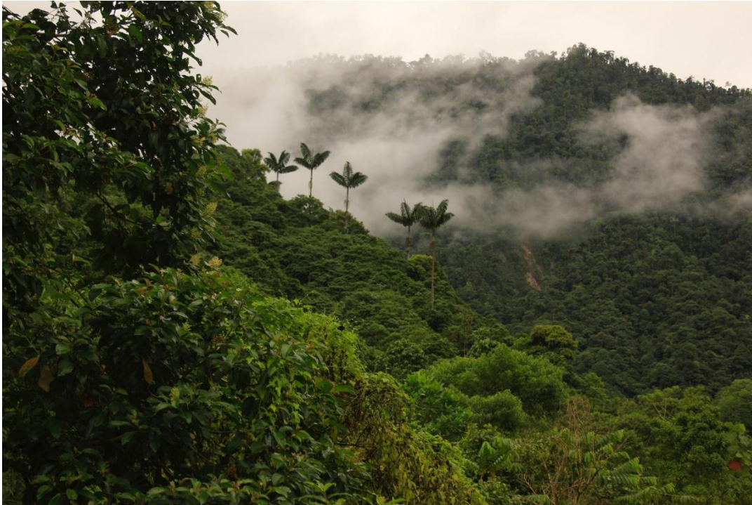
Fotografía 3. Cerro del Oso, Reserva Yakusinchí.