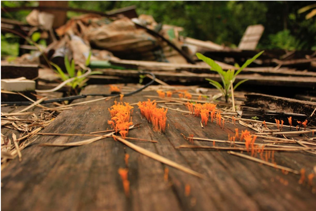
Fotografía 2. Regeneración del bosque sobre la antigua casa de Mimi y Jaime.