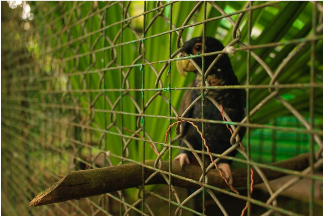
Fotografía 4. Encierro de un loro alibronceado en la Reserva Yakusichi.