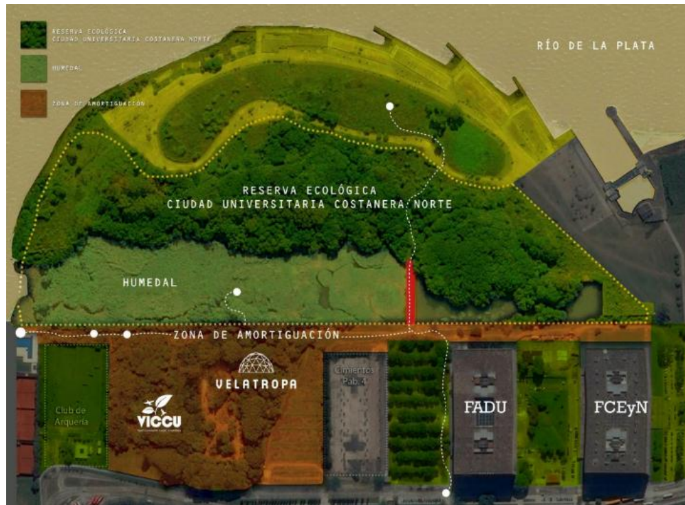
Mapa 2. Ecoaldea Velatropa como zona de amortiguación de la Reserva Ecológica Costanera Norte