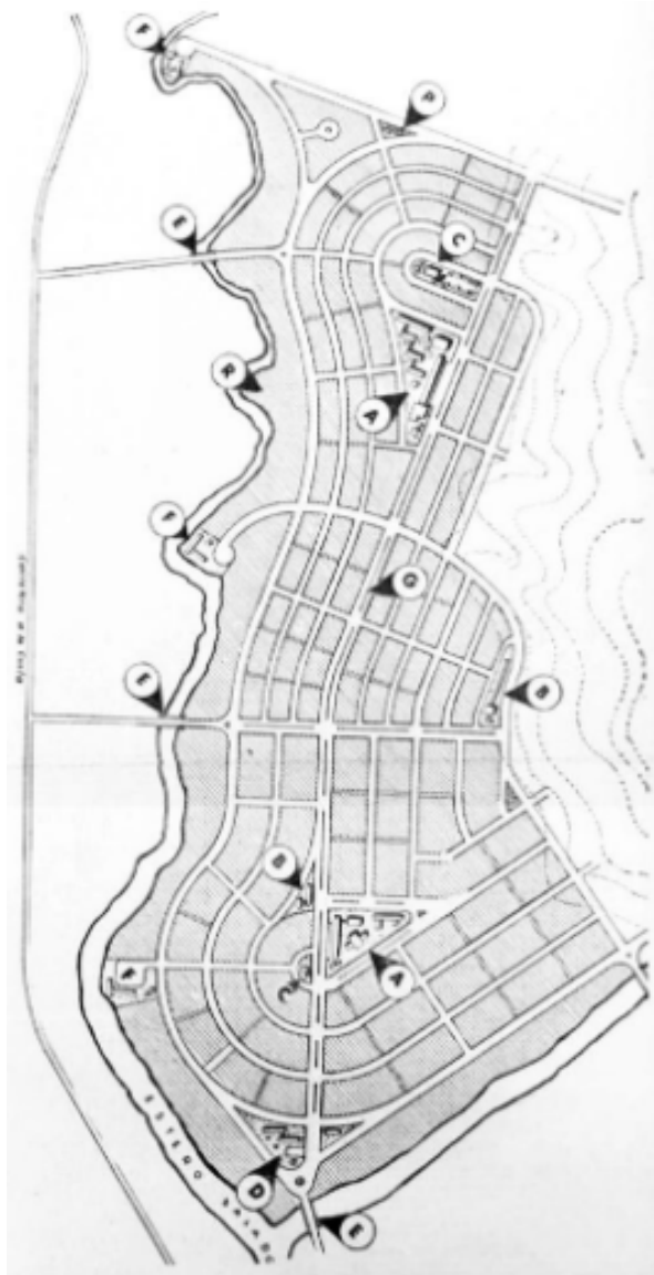
Mapa 3: Propuesta original para Urdesa