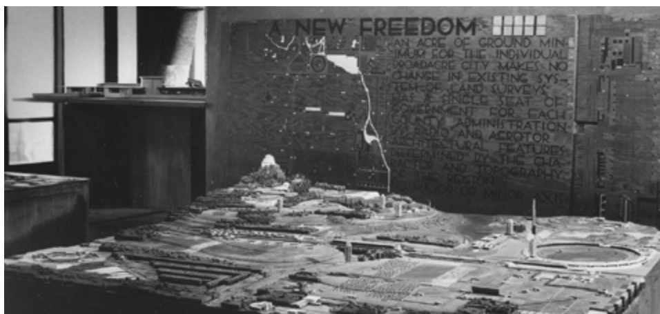
Fotografía 1: Maqueta para Broadacre City, de Frank Lloyd Wright

Habitar en Broadacre significaba que la familia era autosuficiente, y este era el objetivo principal del modelo. A cada familia le correspondía un acre de terreno, en donde solo el 10 % podía ser utilizado para vivienda (Barba, 2017). El área restante del terreno debía dedicarse a la producción de la familia, al trabajo, clasificado en granjas, industrias, mercados y algunas oficinas. Asimismo, en el plan se contemplaba la dotación de equipamiento básico: escuelas, centros deportivos y de espectáculos y amplias zonas verdes, incluso incorporadas a los edificios.