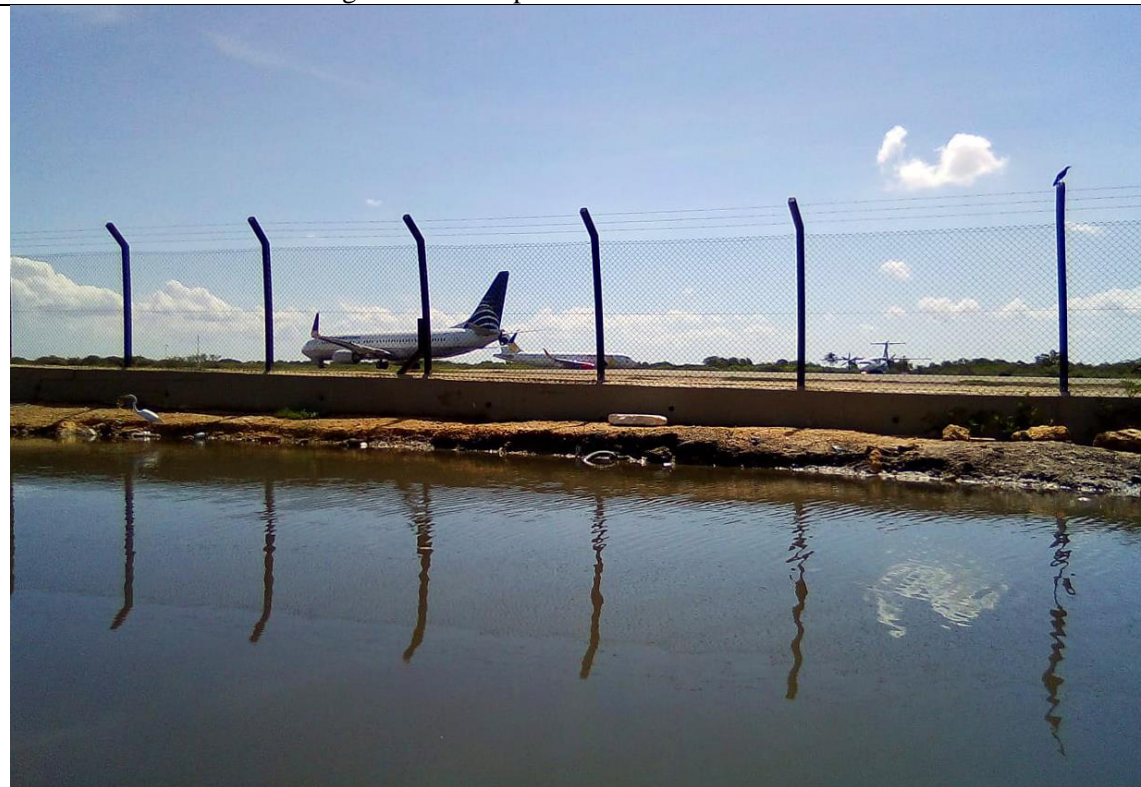
Foto 2: Canal Paralelo y Pista de Aeropuerto Internacional Rafael Núñez