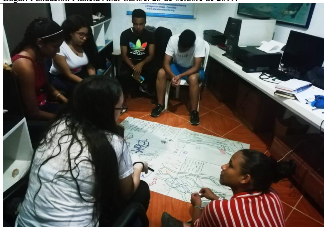
Foto 4: Grupo focal con los y las Guardianes Ambientales Multiplicadores. Lugar: Fundación Planeta Azul Caribe. Fecha: 25 de octubre de 2019.