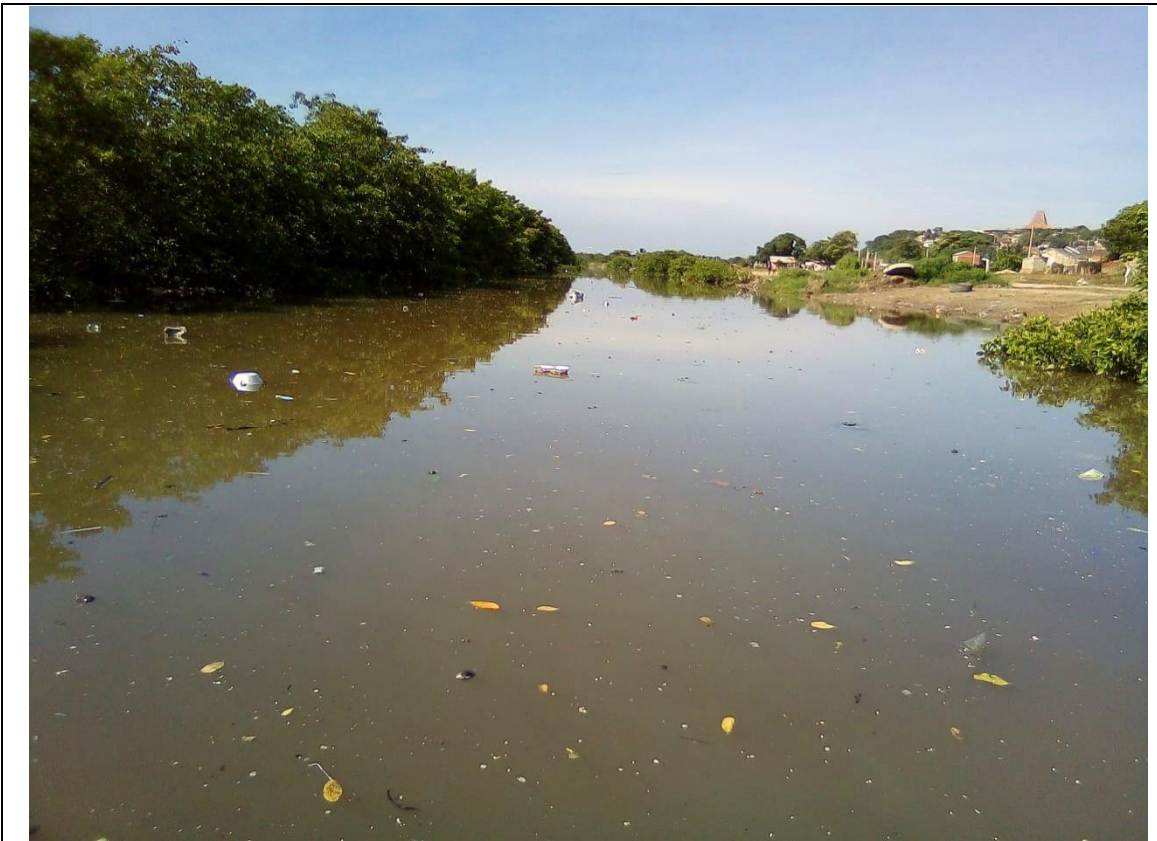
Foto 1: Canal Paralelo.