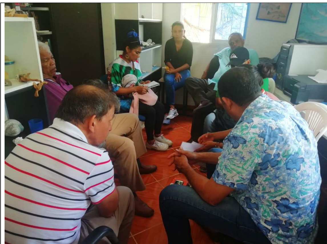
Foto 3: Grupo focal con el grupo de actores y actoras de las organizaciones sociales. Lugar: Fundación Planeta Azul Caribe. 25 de octubre de 2019.