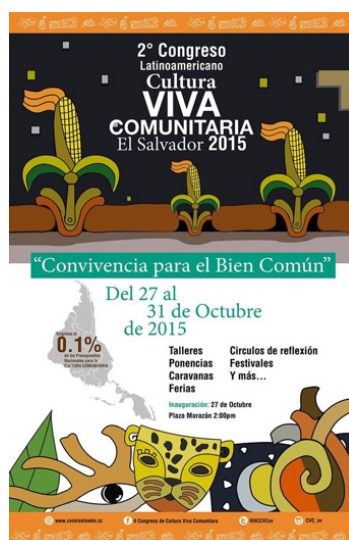
Ilustración 3. Afiche II CLCVC El Salvador-2015.

Este segundo congreso se celebró en El Salvador del 27 al 31 de octubre de 2015, bajo el lema “Convivencia para el bien común”. Los organizadores de este encuentro latinoamericano fueron: la Red Salvadoreña de Cultura Viva Comunitaria, integrada por el Movimiento de Arte Comunitario de Centroamérica, la Asociación Escénica, la Asociación Tiempos Nuevos Teatro (TNT), Instituto Nacional de la Juventud (INJUVE), los Consejos para el Desarrollo Artístico Cultural Comunitario (CODACC), junto con la Secretaría de Cultura de la Presidencia, la Alcaldía Municipal de San Salvador y la Universidad de El Salvador.