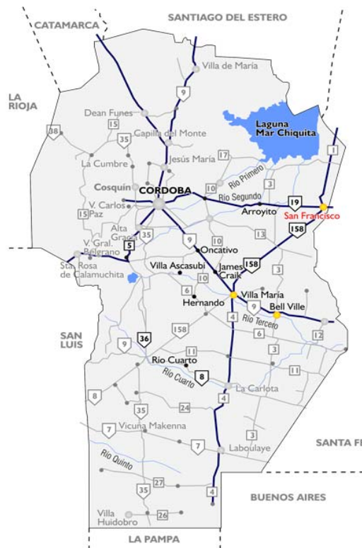
Ilustración 14. Mapa de San Francisco, Córdoba.

A pesar de ser la ciudad con menos organizaciones de la Red del Este Cordobés, se pensó como la mejor opción, ya que contaba con mejor infraestructura para recibir a la caravana latinoamericana dado que el resto de poblaciones aledañas son muy pequeñas. Esto implicó un gran desafío de articular y visibilizar otro territorio más allá de Córdoba capital. El paso de la caravana por San Francisco fue solamente un día, el lunes 13 de mayo de 2019, pero en San Francisco el congreso empezó desde varias semanas antes.