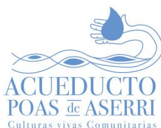
Ilustración 23. Logo Oficina de Culturas Vivas Comunitarias. Acueducto Poas de Aserrí.

La Oficina de Culturas Vivas Comunitarias se vincula con el movimiento latinoamericano a través de la Asociación Yarã Kanic y es beneficiada con el fondo de movilidad del Programa IberCultura Viva que permitió la participación de su gestora, en el III Congreso Latinoamericano de Cultura Viva Comunitaria en Ecuador en el año 2017.