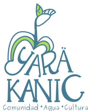
Ilustración 21. Logo Yarä Kanic.

La Asociación Yarä Kanic, o “Sembrando Frijol” en la lengua de la etnia indígena Huetar 81 , nace en el año 2012 y es un colectivo del cantón de Aserri de la provincia de San José en Costa Rica. Fomenta una metodología de trabajo asociada a la Nueva Cultura del Agua, en busca de una interacción comunitaria que resignifique el habitar de su territorio y su relación con el río de su localidad, el Poás. Inicialmente forma parte de la Guanared y a través de ella se incorporó a la animación del MLCVC.