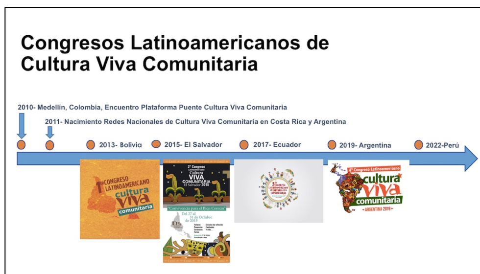
Ilustración 11. Congresos Latinoamericanos de Cultura Viva Comunitaria.

La convocatoria a través de los congresos es una estrategia dirigida a la institucionalización del movimiento. La generación de distintos productos culturales que se engloben en su marco posiciona a los colectivos que participan en el ámbito político y suma a esa institucionalización legitimada a través de la creación colectiva y la ejecución de acciones consensuadas. Es así como la generación de acciones colectivas en nombre del movimiento cobra distintas características.