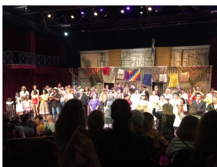
Ilustración 13. Espectáculo Venimos de muy Lejos. Grupo de Teatro Catalinas Sur. 2019.

sobrepasan la esfera nacional sino también la latinoamericana. Esta diferencia de niveles evidencia como una organización territorial logra una importante incidencia a través de la construcción de distintas conexiones. Puede ser considerado como un referente estratégico de la CVC como movimiento, ya que presenta una dinámica funcional y consolidada en red, que sugiere insumos muy apropiados para el proyecto latinoamericano. A su vez, gracias a la vinculación en red incentivada por esta agrupación entre otras, se potencia la anuencia a sumar otras experiencias y adquirir nuevos conocimientos que enriquezcan el intercambio para la acción colectiva.