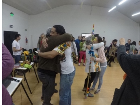
Ilustración 29. Ceremonia de traspaso del bastón. Jornadas de Planificación, Entre Ríos, Argentina.