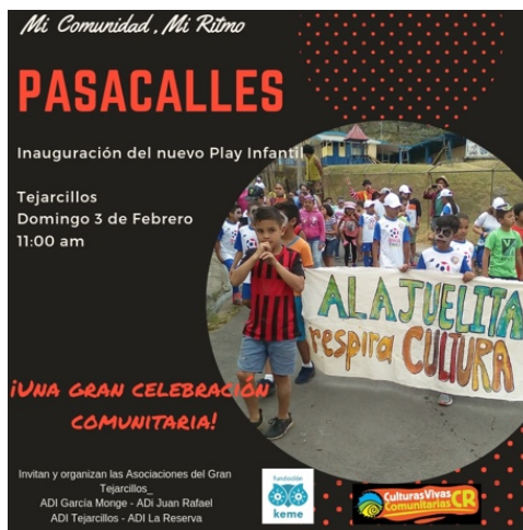
Ilustración 25. Invitación Pasacalles comunitario Tejarcillos-Alajuelita, 2019.

Como parte del proceso de gestión comunitaria desarrollado, les llegó la invitación de la Universidad Estatal a Distancia para participar en una mesa de diálogo de gobiernos locales con organizaciones sociales y en donde también participó la Municipalidad de Alajuelita.