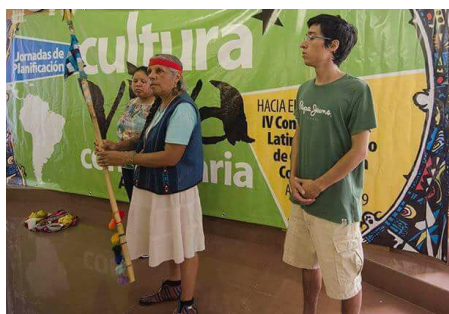
Ilustración 6. Bastón de la Cultura Viva Comunitaria.

La ceremonia del bastón de la Cultura Viva Comunitaria es un ritual incorporado a la dinámica de la red que se realiza con el objetivo de armonizar las energías del colectivo. Así, la dinámica permite a quienes participan (re)conocerse antes de iniciar el diálogo y generar una atmósfera de confianza y disposición del cuerpo para la escucha y el intercambio antes de la toma de decisiones que definirán el camino a seguir a través de la conformación de una nueva agenda de trabajo en común. Para conocer más detalles sobre cómo se realiza esta ceremonia y su vinculación con el movimiento puede ver anexo 5.