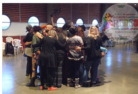
Ilustración 7. Abrazo comunitario. I encuentro de redes. Rivadavia-2017.

El abrazo comunitario es una expresión que alude a la acción de abrazarse colectivamente. Se realiza al finalizar los encuentros de la red como una manera de reforzar la unión del colectivo a través del contacto corporal. Para conocer más detalles de esta expresión cultural colectiva ver anexo 5. «No hay celebración del acuerdo creativo más importante que el abrazo. Estrecha, une, compacta, los cuerpos se hacen uno, de dos o más personas. El abrazo colectivo es el cierre para celebrar la revolución corporal cotidiana» (Nogales,2013,p.114).