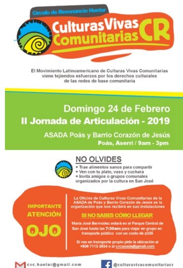
Ilustración 19. Jornada de Articulación Círculo de Resonancia Región Huetar.

A pesar de que el movimiento sufre un letargo organizativo de la red nacional, hay un flujo constante de organizaciones participantes. Así como se retiran algunos colectivos, se siguen sumando nuevos al movimiento o específicamente a los círculos, como el Círculo de Resonancia Huetar. Esto renueva la vibración del colectivo y le inyecta vitalidad y movimiento. También se ha activado la colaboración de las organizaciones que tuvieron representación en el último congreso latinoamericano y otras que continúan desde su participación en el tercer congreso.