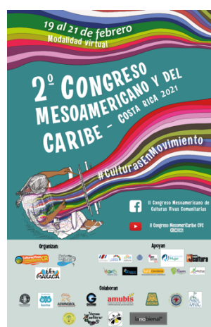
Ilustración 20. Afiche II Congreso Mesoamericano y del Caribe de Culturas Vivas Comunitarias. 2020.

Esto incentivó que las organizaciones interesadas en participar aportaran a la propuesta continental, ahora desde una visión regional más articulada. El reforzamiento de los medios de comunicación virtuales debido a la pandemia, fue un aliado muy adecuado para potenciar la reactivación y el accionar colectivo a pesar de las condiciones mundiales actuales. En ese sentido se resalta la enorme dificultad de reconocerse como región pero también la gran posibilidad de generar conexiones mucho más interactivas y constantes a través de esta nueva virtualidad producto de la crisis sanitaria.