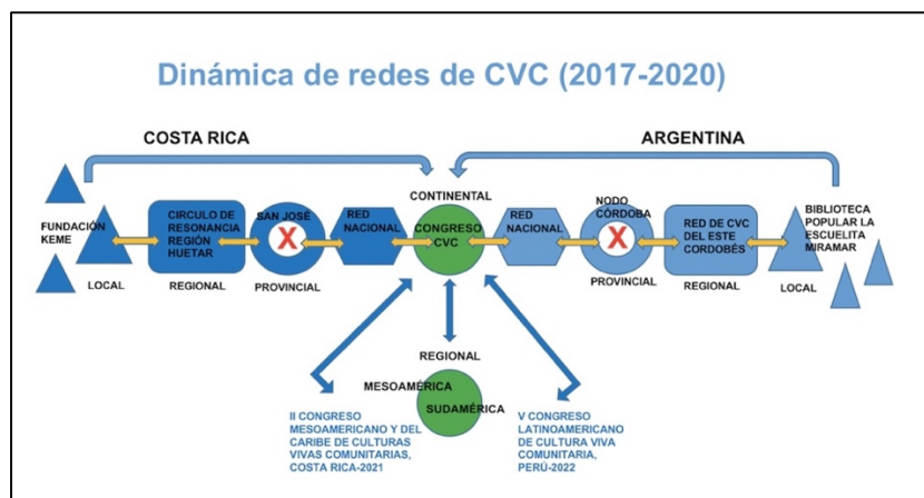
Ilustración 27. Dinámica de la red continental y las redes de Costa Rica y Argentina.

Pequeñas acciones coordinadas desde lo regional o lo temático van sumando de una manera más controlada, definida y constante hacia una construcción más macro. Esa funcionalidad entre lo continental, lo regional y lo local en el caso de la CVC, produce vinculaciones mayores que cada vez son más fieles a su sentir extrapolado.