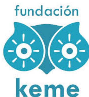
Ilustración 24. Logo Fundación Keme.

Iniciaron su labor en la comunidad organizando fiestas navideñas para los niños y niñas de Tejarcillos de Alajuelita. La actividad la llevaron adelante durante cuatro años y alcanzaron a beneficiar hasta trescientos niños y niñas. Posteriormente, en el 2015 empezaron a formular proyectos culturales más grandes, como festivales artísticos.