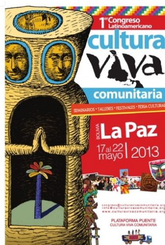
Ilustración 1. Afiche I CLCVC Bolivia-2013.