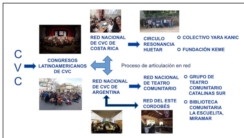
Ilustración 16. Casos de estudio.

En el caso de Costa Rica la experiencia es otra. Principalmente porque las características territoriales, políticas y económicas delimitan otras estrategias de enfrentar los retos y posibilidades de lo comunitario como eje de acción. En el capítulo siguiente se ejemplifica la forma en que ha sido asimilada esta propuesta en el contexto costarricense, así como su puesta en común.