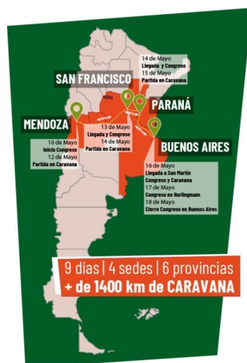
Ilustración 10. Recorrido caravana cuarto congreso. Argentina-2019.