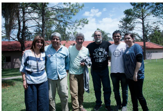
Ilustración 31. Representantes que recibirán el congreso de cultura comunitaria.