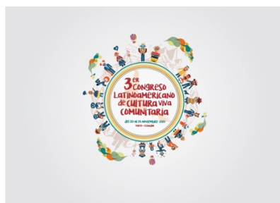
Ilustración 5. Afiche III CLCVC. Ecuador-2017.

Cincuenta y dos de estos congresales fueron seleccionados (as) a través de la convocatoria de movilidad de IberCultura Viva. Este congreso fue organizado por la Red Ecuatoriana de Cultura Viva Comunitaria, con el apoyo de treinta y cuatro comunidades de Quito, con el objetivo de facilitar un espacio de intercambio y articulación entre experiencias y redes en todo el continente e impulsar ámbitos de recuperación y fortalecimiento de iniciativas legislativas y de política pública estatal en relación con el sostenimiento de experiencias culturales comunitarias.