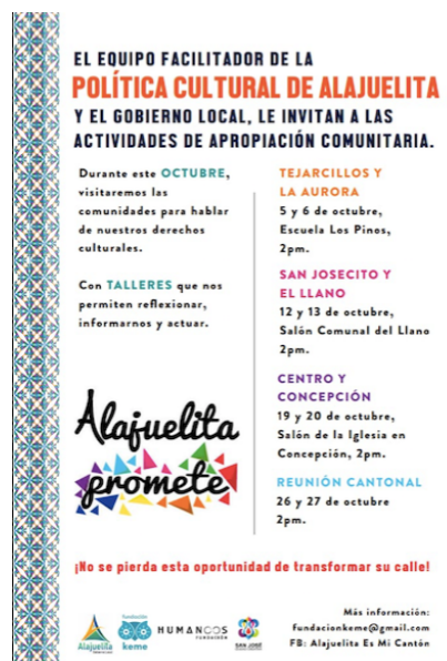
Ilustración 26. Convocatoria participativa Política Cultural de Alajuelita.

Llevamos el santo libro, lo fotocopiamos y fuimos y les dijimos: ¿ustedes sabían que se debe trabajar el fortalecimiento de las instituciones, de los actores y actrices trabajadores de lo cultural de la comunidad, los artesanos? Todos estábamos contemplados y nunca se nos hubiera ocurrido pensar que había ya un documento que decía eso. Y analizamos eje por eje la política, los leímos y los transformamos y aplicamos a nosotros. Entonces surgió la idea de que en lugar de tomar el último eje de pueblos indígenas, había tanto migrante y personas con discapacidad en la comunidad que se sugirió promocionar los derechos de las culturas de las personas migrantes, para que fueran incluidas en las distintas agendas de trabajo cantonal (Vocera Fundación Keme. Alajuelita-San José, Costa Rica. Conversación personal, 5 de febrero de 2019).