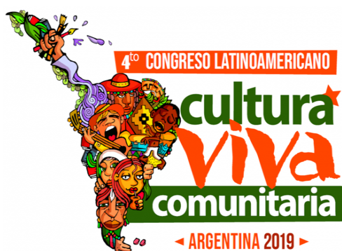
Ilustración 9. Afiche IV CLCVC. Argentina 2019