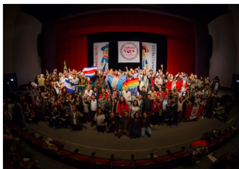
Ilustración 8. Plenaria de apertura. III CLCVC, Ecuador.

Por otro lado, desde el desarrollo local se evidenció la pertinencia de la propuesta política a través de iniciativas culturales y artísticas exitosas en territorio, que le sirven de ejemplo o inspiración para sugerir nuevas acciones dentro de las organizaciones participantes. En el caso de Ecuador, el congreso resultó un impulso clave en el fortalecimiento de la red y la maduración de la propuesta que logró concretarse con el lanzamiento de la línea de fomento a la Cultura Viva Comunitaria en setiembre de 2019 por parte del Ministerio de Cultura y Patrimonio (ver anexo 6).