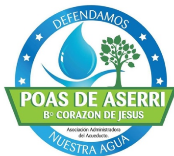
Ilustración 22. Logo ASADA Poas de Aserrí.

La Asociación Administradora del Acueducto Rural de Poás y barrio Corazón de Jesús de Aserrí 83 , brinda el servicio de abastecimiento de agua potable a alrededor de once mil personas, siendo uno de los acueductos comunitarios de mayor cobertura del cantón. Su principal fuente corresponde al río Poás, que además abastece a comunidades del cantón de Desamparados ubicadas aguas abajo. Este río forma parte de la cuenca Tárcoles, que es reconocida como la cuenca más contaminada a nivel centroamericano. Los cerros que ven nacer a este río presentan una alta vulnerabilidad de deslizamiento y forman parte de la zona protectora de los cerros de Escazú. Todos estos elementos, hacen que la gestión del agua de este río sea de una importancia socioambiental de relevancia en la zona. Por tanto, es fundamental que estas comunidades participen activamente en la protección de la cuenca.