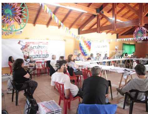
Ilustración 30. El debate en torno a los lineamientos del encuentro.

El encuentro será del 10 al 17 de mayo del próximo año y promete convocar a más de 400 personas. Este fin de semana, nuestra ciudad recibió a representantes del movimiento cultural comunitario para sentar los lineamientos del evento.