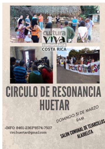
Ilustración 18. Afiche activación Círculo de Resonancia Región Huetar.

(Chorotega) y Zona Norte (Huetar Norte). Esto con el fin de que a través de esta metodología de trabajo, se promovieran de forma participativa procesos de cambio en los ámbitos políticos, culturales, económicos y sociales que atraviesan a los derechos culturales.