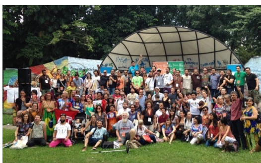
Ilustración 4. Plenaria de cierre. El Salvador-2015.

Para la Red Salvadoreña de Cultura Viva Comunitaria, el segundo congreso latinoamericano es la continuidad de un proceso de emancipación y autonomía de carácter popular local, que se articula hoy un esfuerzo continental, en el que muchos actores sociales trabajamos por una agenda común. Una agenda que ha venido desarrollándose desde, con y para las comunidades a lo largo de los últimos quince años. Se trata de ciento veinte mil experiencias populares y comunitarias que existen en el continente (Melguizo,2015,p.125).