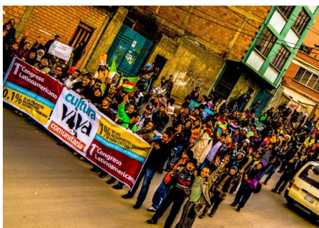
Ilustración 2. Caravana, Bolivia-2013.

Al finalizar este primer congreso, se lograron concretar algunas acciones como la articulación de al menos diez grupos de coordinación de una agenda conjunta del tejido de Cultura Viva Comunitaria en El Alto y la propuesta de apoyar una Ley de Cultura Viva Comunitaria al acordar la lucha continental por el 0.1%. También se declaró al 22 de mayo de cada año “Día Internacional de la Cultura Viva Comunitaria”, se conformó el Consejo Latinoamericano por la Cultura Viva Comunitaria como eje vinculador de la red. Se propuso la organización de congresos nacionales como esfuerzo para articular la red en cada país, así como una sede en Centroamérica para el siguiente congreso con el objetivo de integrar la región. Estas acciones marcaron el inicio del tejido latinoamericano 46 (ver anexo 4 sobre memoria del congreso).