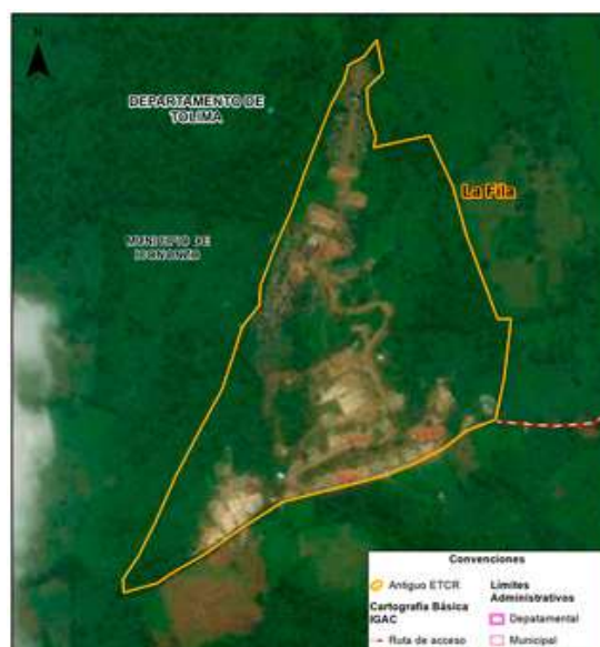
Figura 4.1 AETCR La Fila - Tolima