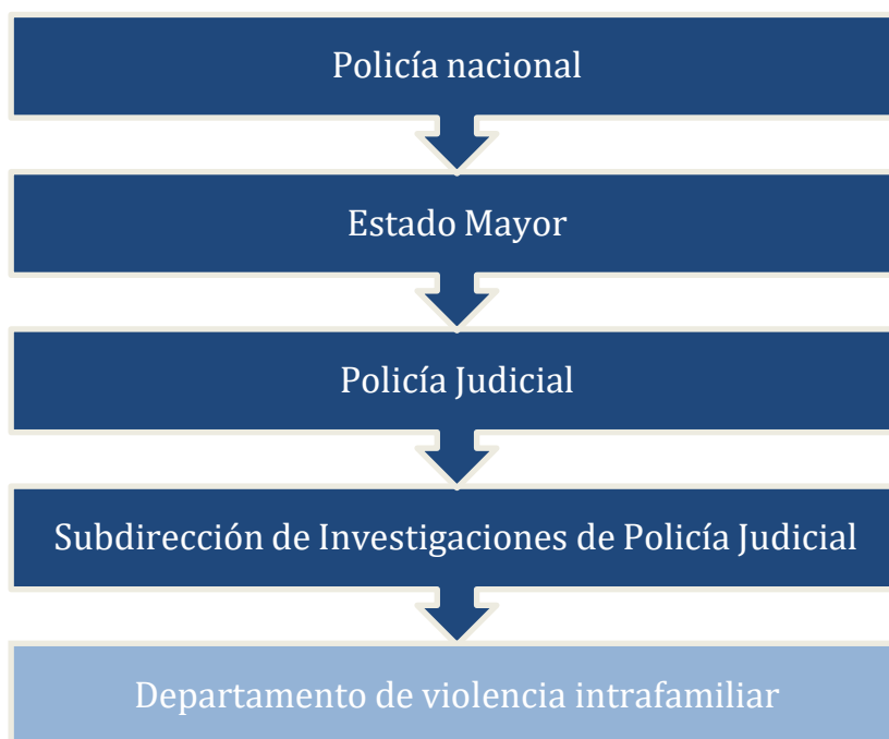
Ilustración 1. Ubicación Jerárquica del Departamento de Violencia Intrafamiliar.