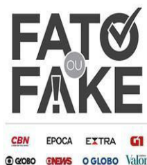
Figura 1 - Apresentação visual do Fato ou Fake

O projeto traz a transparência de informações como principal critério de checagem, e para isso serão consideradas: a transparência de fontes, na qual será apresentado, com clareza, o caminho de apuração percorrido pelo jornalista. Dessa forma, todas as fontes consultadas, pessoas ou instituições, serão identificadas nos textos; a transparência de metodologia, que deixará claro o processo de seleção da mensagem a ser checada, a apuração e a classificação da checagem, mostrando, assim, o porquê de tal notícia ser considerada fato ou fake ; e a transparência de correções, que irá identificar na reportagem se houver alguma alteração na checagem que tenha comprometido a publicação original. Abaixo a apresentação visual da seção: