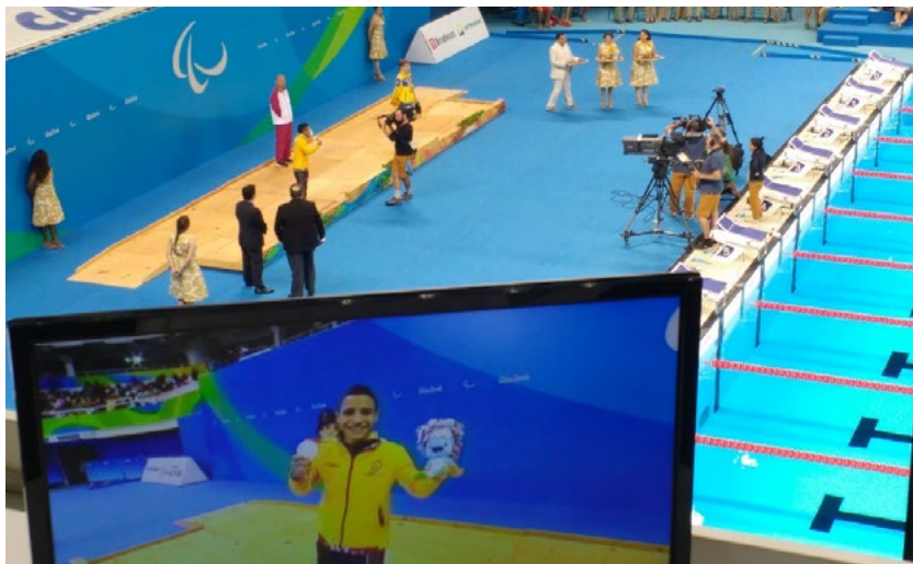
Figura 3. Zona de prensa en las piscinas de la ciudad olímpica