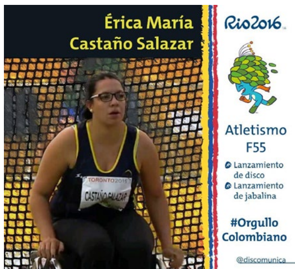
Figura 1. Flyer promocional de Discomunica