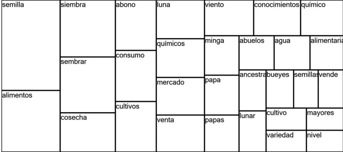
Figura, 2. 4 Mapa ramificado

contribuyen a reducir la vulnerabilidad de los pueblos en especial de los más pobres y aislados.