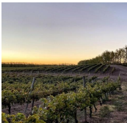
Extraído de: Bodega Del Fin del Mundo (findelmundowines) Fecha: 2/07/2021

Bodega Malma: considerada una bodega familiar, fue fundada en el año 2003 y comenzó a producir al año siguiente. Los vinos son elaborados con uvas provenientes de 127 hectáreas de viñedos propios. Produce cerca de 1.200.000 litros de vino que comercializa principalmente a tres países Brasil, Estados Unidos y Reino Unido. Cuenta con 200 barricas de roble. De la producción total, el 70% es para el mercado nacional y el 30% restante se exporta, aunque el desafío es llegar a un 50% destinado al mercado nacional y el otro 50% al mercado internacional.