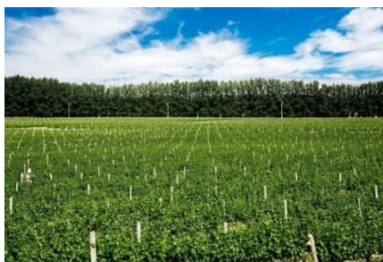
Fecha: 16/12/2020

Bodega Secreto Patagónico: fundada en el año 2003, su primera cosecha fue en el año 2006. Posee plantaciones de diversas variedades. Realizan toda la cosecha en forma manual, sin utilizar máquinas cosechadoras para preservar la integridad del fruto. Tiene una capacidad de producción de entre 80 a 100.000 litros por año aproximadamente.