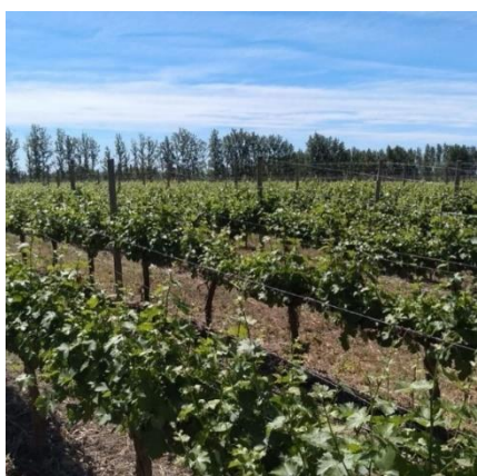
Fecha: 03/11/2020

Bodega Grupo Peñaflo Patagonia: recientemente adquirida por el Grupo Peñaflo. Posee 110 hectáreas de viñedos. Cuenta con tecnología de última generación. Tiene una capacidad de producción de 900.000 litros por año aproximadamente.