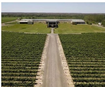
Extraído de: Bodega Malma (malmawines) Fecha: 27/12/2019