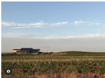
Fecha: 21/05/2020