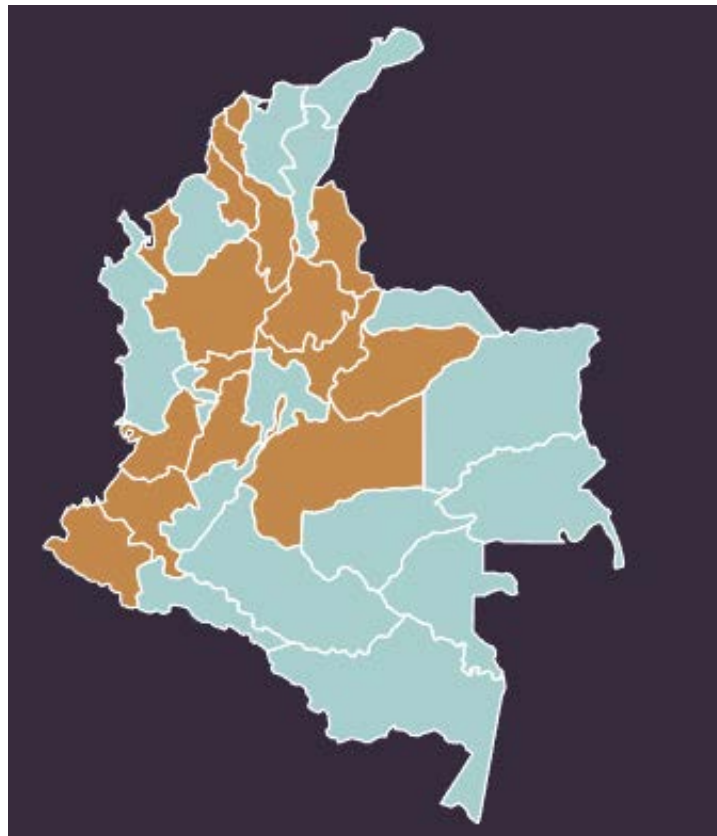
Mapa #1. 15 Capítulos regionales del MOVICE