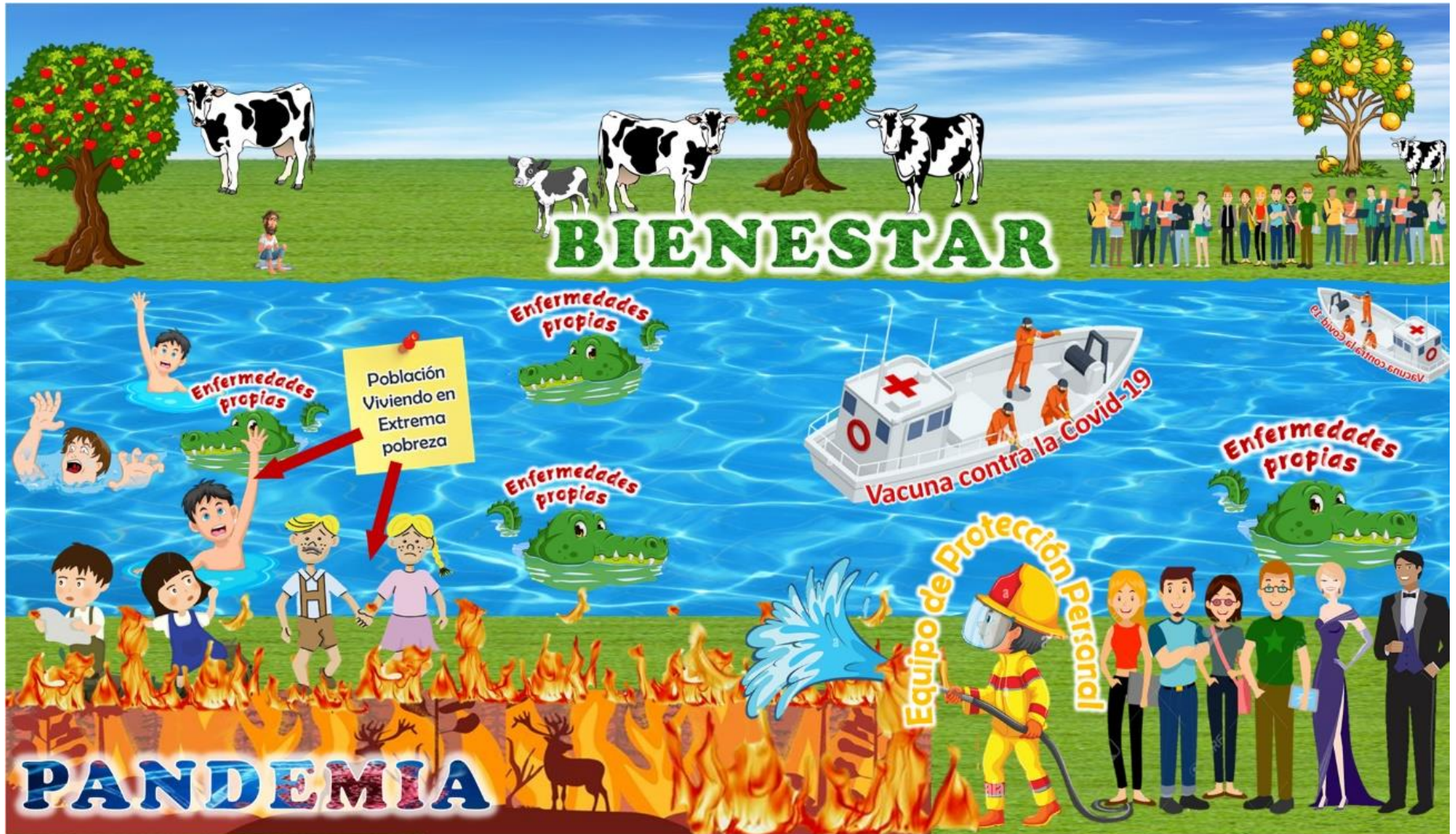
Figura 2. Modelo del incendio para explicar el impacto de la asignación prioritaria de las vacunas sobre las poblaciones viviendo en pobreza extrema.