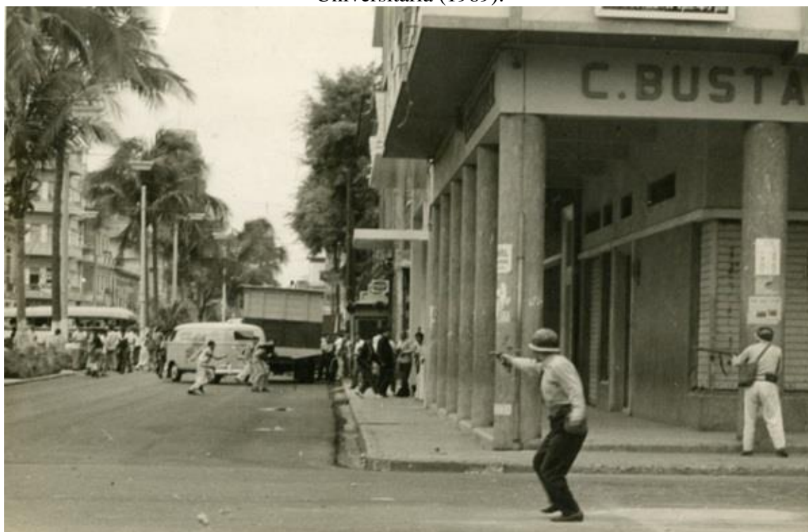
Foto 3.1. Represión Ejercida por el Gobierno de Velasco Ibarra. En esta fotografía publicada por Diario El Universo, se aprecia a la Policía de Guayaquil en plena actividad represiva ejecutando el desalojo de los estudiantes secundarios que se habían tomado la Casona Universitaria (1969).