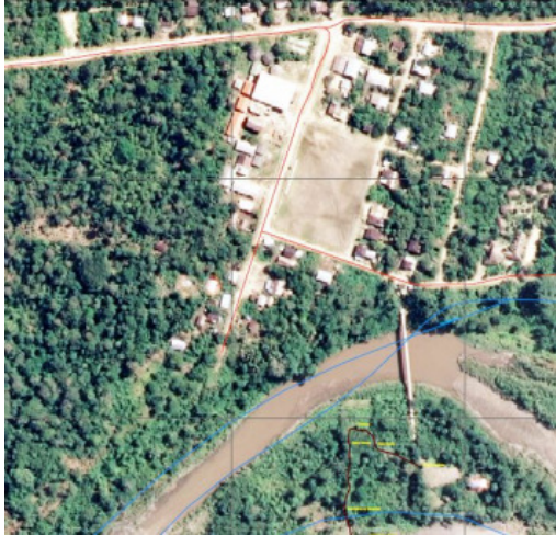
Gráfico 2.2 Mapa geográfico Comunidad de Shandia

Sin embargo, la comunidad de Shandia la cual está conformada por 65 familias que corresponde aproximadamente 365 habitantes, pertenece al grupo étnico Kichwa. Además, como ejes de organización política se encuentra legalizada por la CONDEPE y afiliada a la Federación de Organizaciones de la Nacionalidad kichwa de Napo (FONAKIN), a la CONFENAIE y a la CONAIE (Shandia 2015).