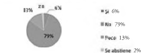
Tabla y Gráfico N°2 Percepción de la carrera de Bibliotecología