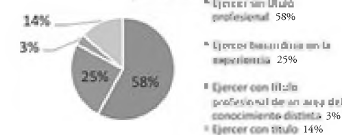
¿Cree usted que para ejercer sus funciones, el Bibliotecólogo requiere de un título profesional afín?