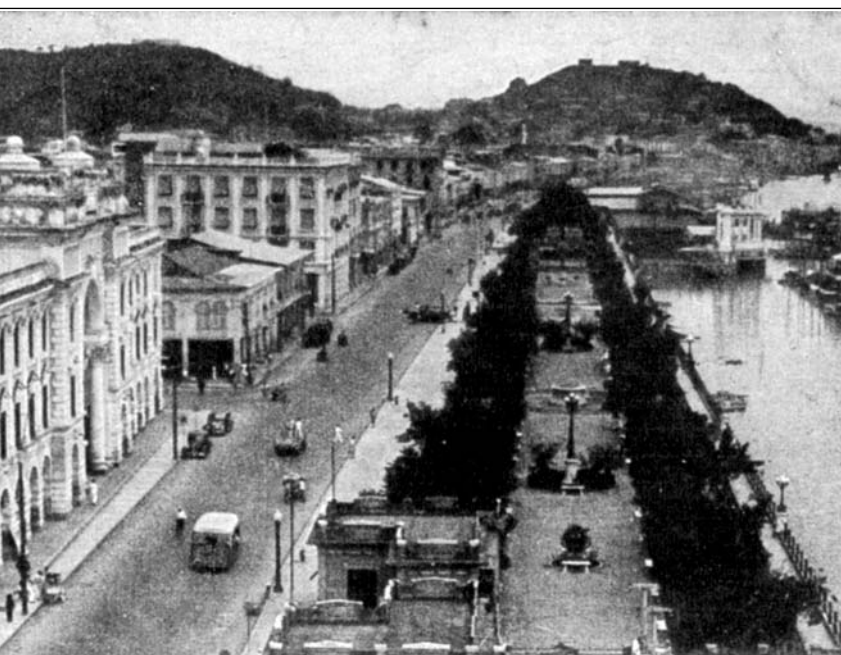
El malecón de Guayaquil hacia 1950