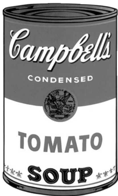
Andy Warhol, Campbell's Soup Can I, 1968

Sin embargo, Guy Debord ya en 1967 proponía definir al espectáculo no como un “conjunto de imágenes sino como una relación social entre personas, mediatizada a través de imágenes”, y explicaba que “no se puede oponer el espectáculo a la actividad social efectiva, (ya que) el espectáculo que invierte lo real tiene lugar en la realidad...” (Debord 1995 -1967-). Para decirlo ahora por fuera de