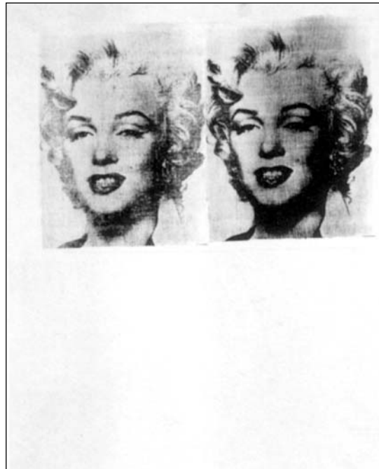
Andy Warhol, Marilyn Twice, 1962

El control sobre las imágenes no garantiza el sentido de las imágenes; la ausencia de imágenes o de representaciones visuales, musicales, literarias escinde los procesos de transfiguración de lo real, de transformación de los discursos, de debate sobre la realidad. El mismo presidente Bush toma inmediatamente una medida prohibitiva: no mostrar cadáveres, no mostrar violencia en la televisión, censurar el cine. La misma actitud que habría de tomar el supuesto enemigo un tiempo antes al destruir ídolos en Bamyán, para luego mostrar la vulnerabilidad de su adversario por la vía de sus emblemas. La censura talibán en Afganistán iría tan lejos que ninguna imagen circularía ya, abolidas por entero las fotografías, las pinturas y toda forma de representación bidimensional o audiovisual, a excepción de las marcas que subsistían en los pocos vehículos o productos importados. Los libros fueron todos quemados y sólo los que fueron enterrados se salvaron, y la música prohibida, hasta la de los pájaros cantores que fueron exterminados. Ningún close-up en la televisión de Estado ni en el restringido noticiero 4 . El resultado es un silencio aterrador, al que no podemos oponer la proliferación de imágenes sino la toma de palabra, la expresión de una resistencia. Si bien a través de las imágenes mismas se puede impedir ver porque “es más fácil prohibir ver que permitir pensar”, y aunque “se decide controlar la imagen para asegurarse del silencio del pensamiento y luego,