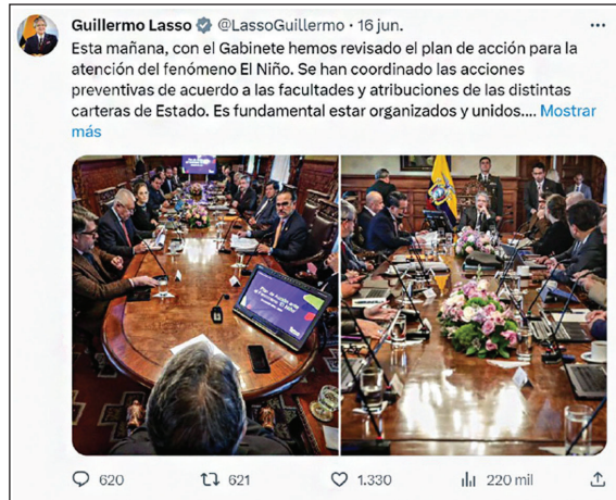
Figura 5. Representación de la iniciativa (variable “tipo de lenguaje”)