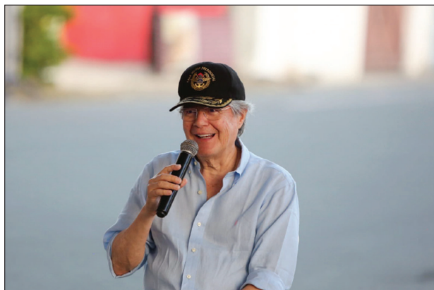
Figura 7. Autorrepresentación del líder como héroe (variable “imagen”)

Este giro también se observa en la imagen hollywoodiense de sí mismo que ha mantenido constante durante su gobierno y que retoma tras la convocatoria electoral: