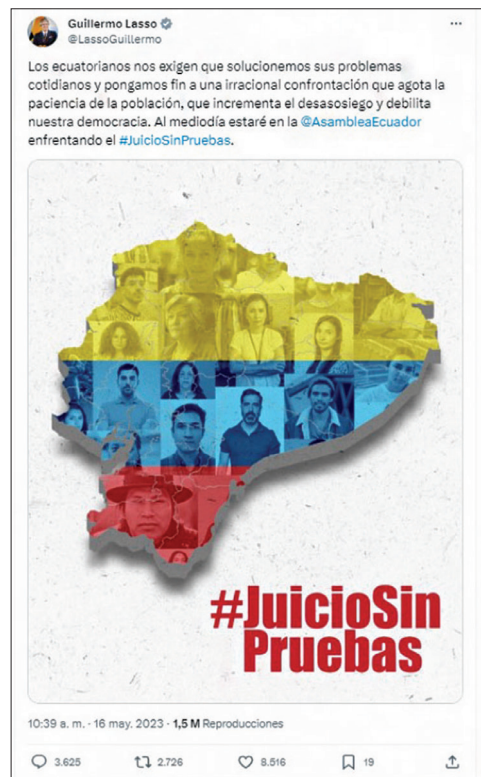
Figura 1. Estrategia de ataque al adversario político (variable “tono del lenguaje”)

Durante la intervención de Lasso por el juicio político, identificamos una estrategia de ataque a la oposición. El expresidente se refiere a una “acusación absurda de un grupo opositor que no entiende de verdades, de justicia ni de democracia” (Lasso 2023a), incluso desconociendo que se trata de autoridades electas (asambleístas) y que el juicio político es una medida constitucional de fiscalización (figura 1).