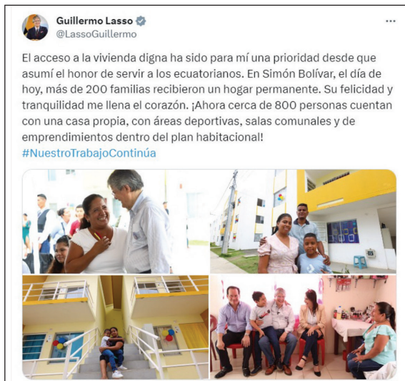
Figura 6. Representación de liderazgo y acción (variables “tipo de lenguaje” y “tono del mensaje”)