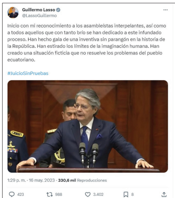
Figura 3. Empleo de recursos literarios (variable “tipo de lenguaje”)

También encontramos el recurso de la ironía y la exageración en un mensaje que se difundió en ambos espacios: en redes sociales y en la Asamblea Nacional: “Han hecho gala de una inventiva sin parangón en la historia de la República. Han estirado los límites de la imaginación humana” (Lasso 2023b).