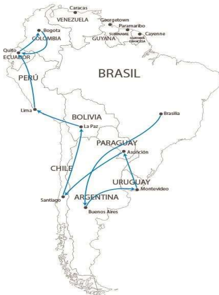
Mapa 2.1 Migraciones de Ancestros de Alfredo Yankovich