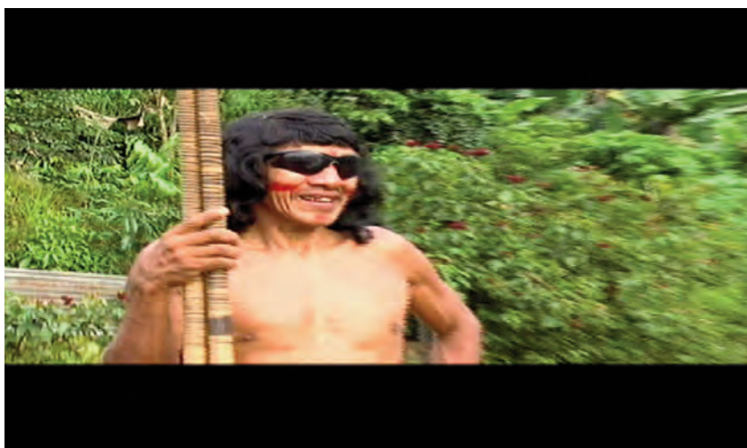
Fotograma 5 Taromenani: El exterminio de los pueblos ocultos (2007), Carlos A. Vera

En este sentido, se plantea una intención de objetividad al demostrarse que en el hecho de la matanza se evidencia la condición incivilizada en que viven los indígenas cuyo culpable es el Estado, mirándose al indígena desde la perspectiva de “buen salvaje” en tanto víctima y/o “tesoro” que debe ser salvado. La interpretación del mundo histórico se establece en este propósito de objetividad que a su vez ubica a la mirada dentro de un orden social tendiente a categorizar a los indígenas, dentro de un determinado mundo en el cual deben permanecer y que debe concordar con la forma de actuar y vivir del indígena que el orden social ha establecido.