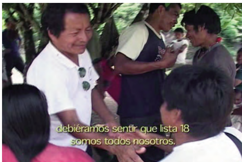
Fotograma 6 Tu sangre (2005), Julián Larrea

Asimismo, la modalidad de representación interactiva forma parte de la construcción de esta mirada crítica, pues, la posición del realizador dentro del documental como un participante in situ de los acontecimientos permite percibir cierta cercanía entre la cámara y los sujetos representados, proponiéndose a los indígenas y colonos como las voces principales del documental. De igual forma, la estructura narrativa permite contrastar las posiciones de colonos e indígenas, por