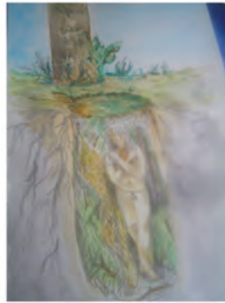
Entierro con hamaca y lanza rota