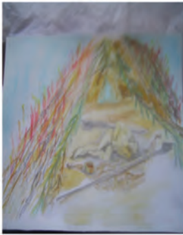
Incineración con lanza, machete y chicha