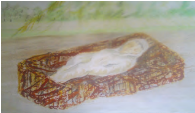
Imagen N.º 9 Entierro de bebé en Quehueiri-ono

Sin embargo cuando ocurrieron dos muertes en la comunidad mientras se realizaba esta investigación se pudo constatar a través de observación directa que al bebé fallecido solamente se le enterró con una sábana y una flor de plástico colocada en su pecho.