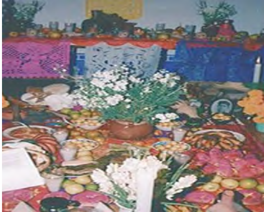
Imagen N.º 1 Ofrendas gastronómicas en el día de los difuntos en México