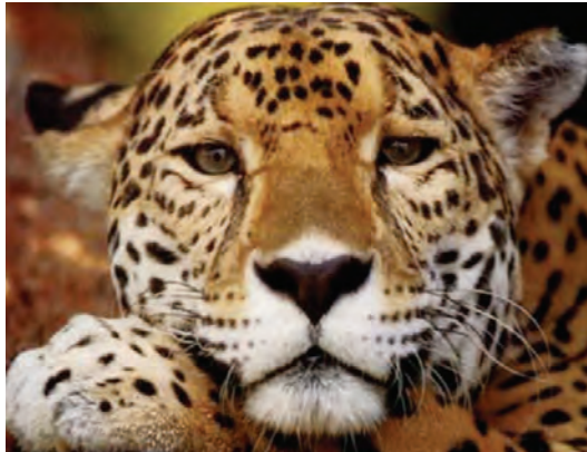
Imagen N.º 3 El jaguar americano