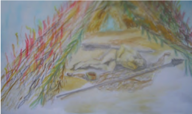
Imagen N.º 5 Incineración de la maloca con el difunto y sus pertenencias