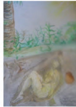
Entierro con olla de barro