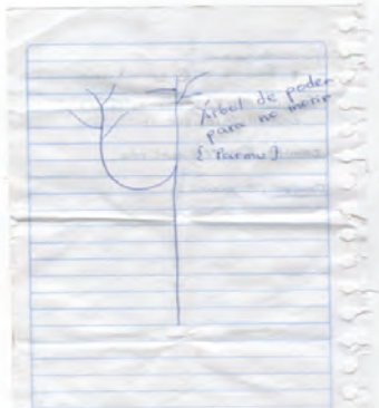
Imagen N.º 4 El árbol de poder para no morir: Parmu

A propósito mis notas registran que la comunidad no tiene miedo ya que uno de sus miembros sembró un ‘árbol de poder’ para que nadie muera en la comunidad. Este árbol está detrás de la maloca y su nombre es Parmu que significa Árbol de poder para no morir (Entrevista colectiva, 2009).