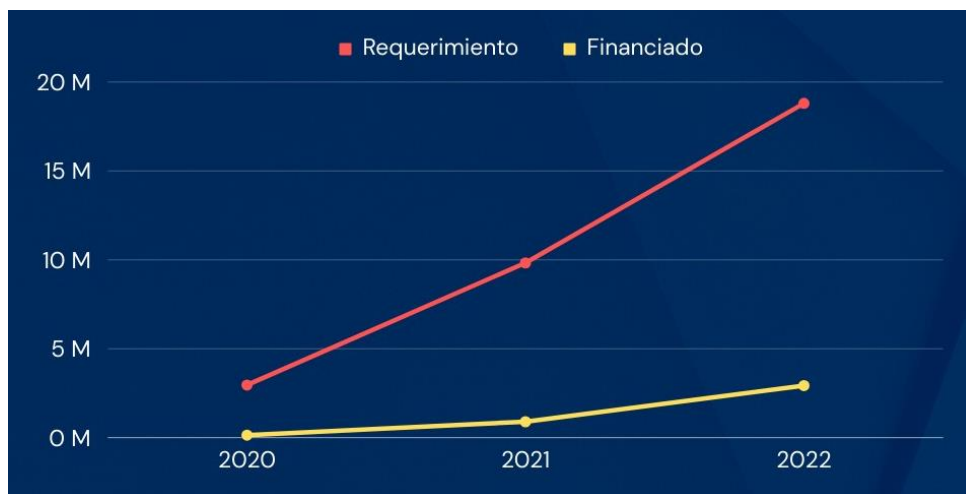
Gráfico 3.6. Requerimiento vs. financiado, salud

Elaborado por el autor con base a los datos de los planes y reportes de fin de año del 2019 al 2022