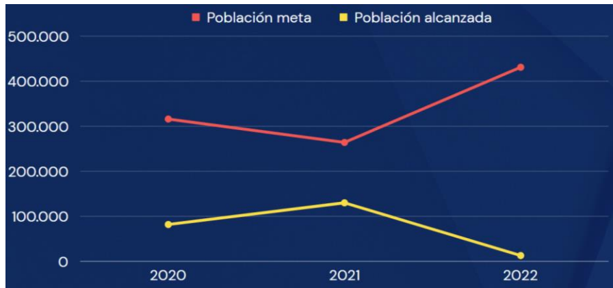
Gráfico 3.15. Población meta vs. Población alcanzada, protección general

Elaborado por el autor con base a los datos de los planes y reportes de fin de año del 2019 al 2022