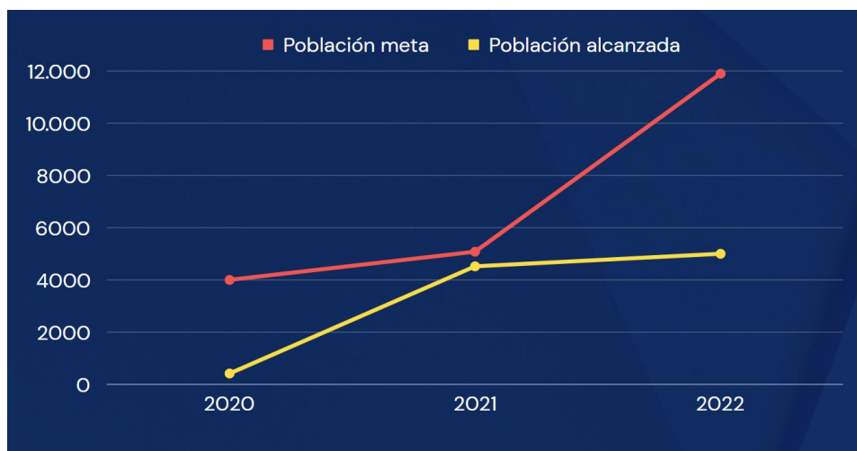
Gráfico 3.7. Población meta vs. Población alcanzada, transporte humanitario

Elaborado por el autor con base a los datos de los planes y reportes de fin de año del 2019 al 2022