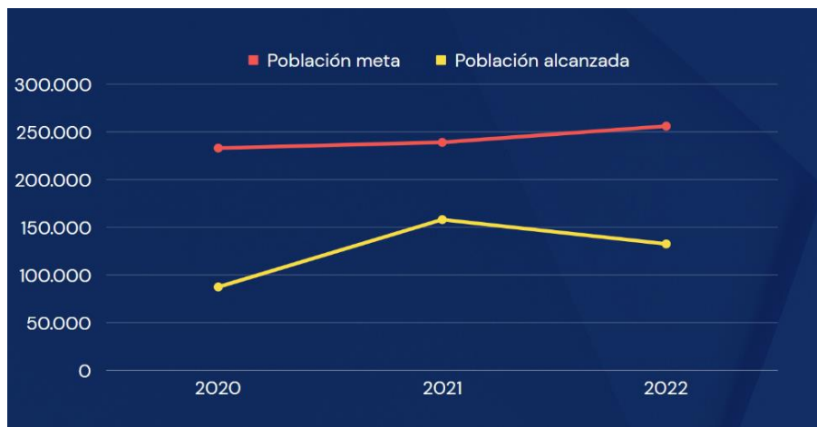
Gráfico 3.3. Población meta vs. Población alcanzada, seguridad alimentaria

Elaborado por el autor con base a los datos de los planes y reportes de fin de año del 2019 al 2022