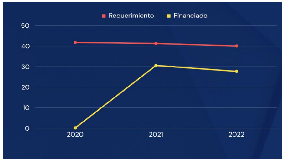
Gráfico 3.4. Requerimiento vs. financiado, seguridad alimentaria

Elaborado por el autor con base a los datos de los planes y reportes de fin de año del 2019 al 2022