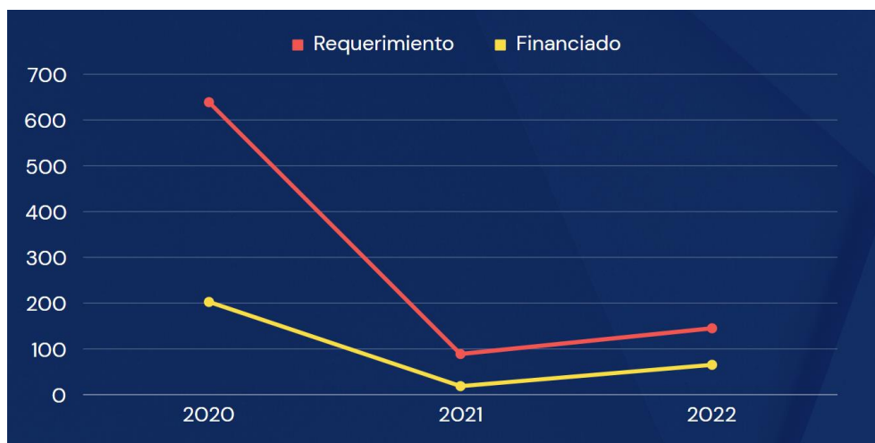
Gráfico 3.8. Requerimiento vs. financiado, transporte humanitario

Elaborado por el autor con base a los datos de los planes y reportes de fin de año del 2019 al 2022