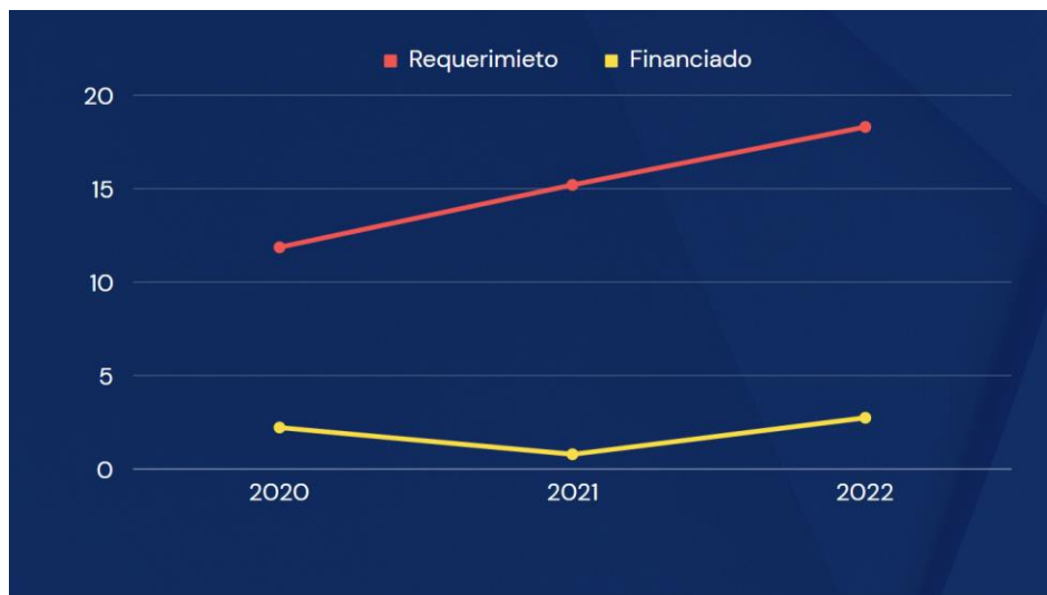
Gráfico 3.2. Requerimiento vs. financiado, educación

Elaborado por el autor con base a los datos de los planes y reportes de fin de año del 2019 al 2022