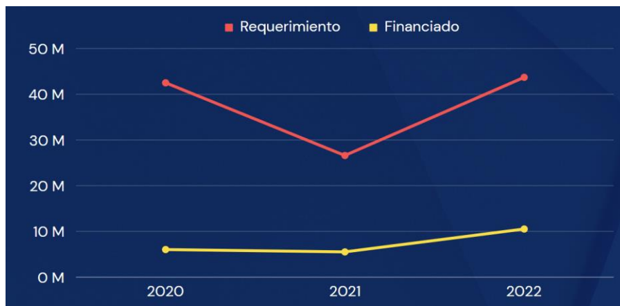
Gráfico 3.16. Requerimiento vs. financiado, protección general

Elaborado por el autor con base a los datos de los planes y reportes de fin de año del 2019 al 2022