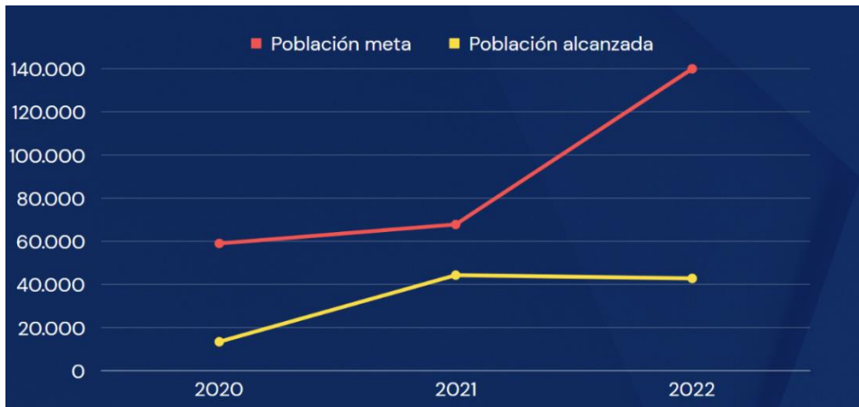
Gráfico 3.1. Población meta vs. Población alcanzada, educación

Elaborado por el autor con base a los datos de los planes y reportes de fin de año del 2019 al 2022