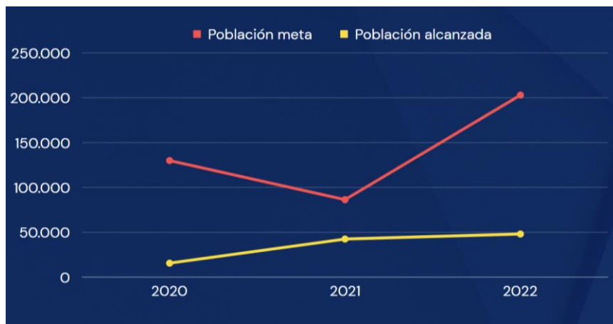
Gráfico 3.9. Población meta vs. Población alcanzada, integración

Elaborado por el autor con base a los datos de los planes y reportes de fin de año del 2019 al 2022