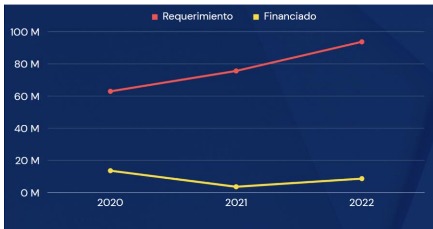
Gráfico 3.10. Requerimiento vs. financiado, integración

Elaborado por el autor con base a los datos de los planes y reportes de fin de año del 2019 al 2022