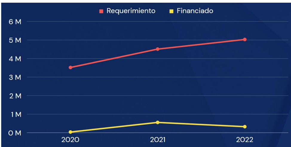
Gráfico 3.14. Requerimiento vs. financiado, WASH

Elaborado por el autor con base a los datos de los planes y reportes de fin de año del 2019 al 2022