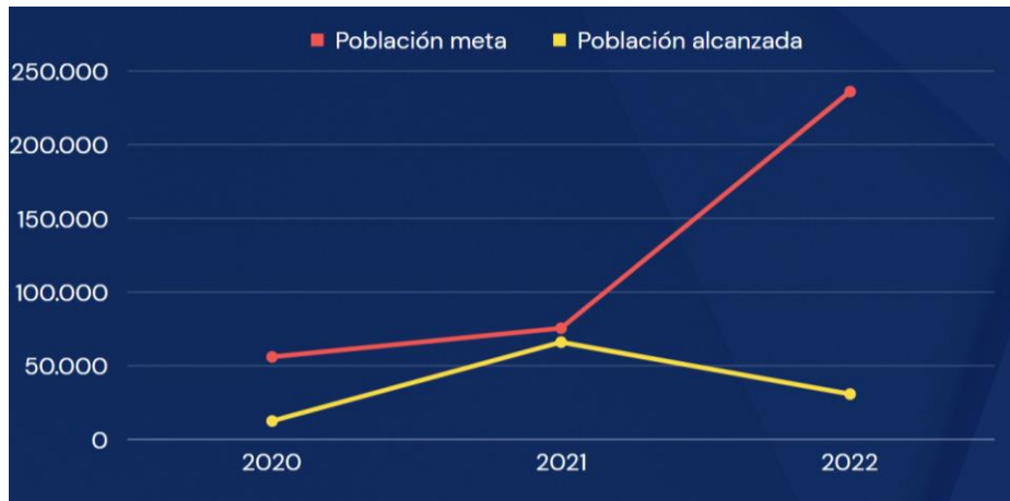
Gráfico 3.11. Población meta vs. Población alcanzada, alojamiento

Elaborado por el autor con base a los datos de los planes y reportes de fin de año del 2019 al 2022