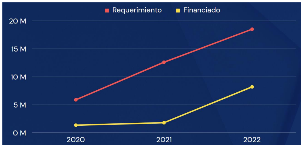
Gráfico 3.12. Requerimiento vs. financiado, Alojamiento

Elaborado por el autor con base a los datos de los planes y reportes de fin de año del 2019 al 2022