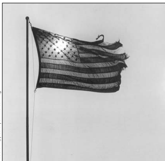
Robert Mapplethorpe. American Flag. 1979

to. Estos impedimentos son el control sobre la transportación y el control sobre las comunicaciones.