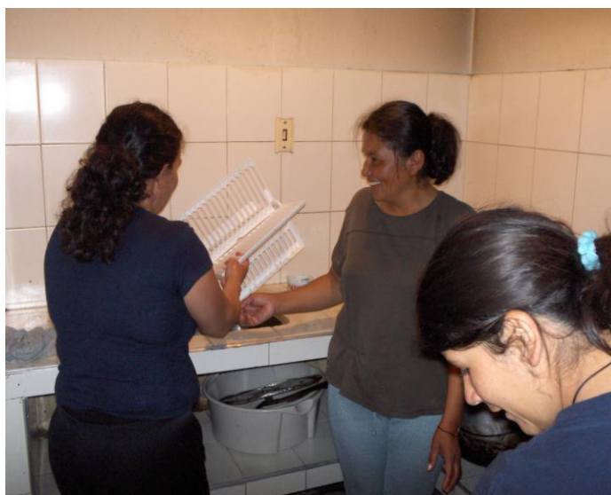
Fotografía No. 1. Asociadas de “Yo Mujer”, en la Cocina Foto tomada el 20 de octubre de 2006.