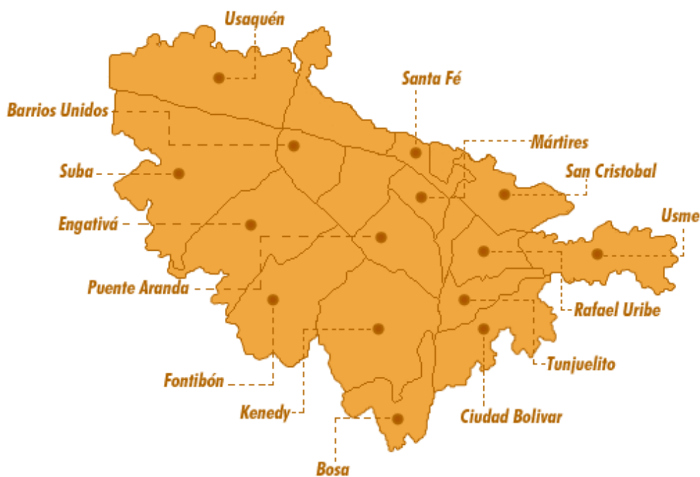
Mapa No. 1 35

Luego de mucho buscar, un día decidieron subir a Ciudad Bolívar en el barrio Sierra Morena. Esta es la localidad 19 de Bogotá, compuesta por 360 barrios, ubicada en la zona sur –oriental del Distrito Capital, limita al norte con la localidad de Bosa, al oriente con las localidades de Tunjuelito y Usme, al occidente con el municipio de Soacha y al sur con Usme y una de las zonas más marginales de la ciudad. Cuenta con una población de 713.764 habitantes aproximadamente. Según datos de la secretaría de gobierno de Bogotá La población que habita en esta localidad está ubicada, mayoritariamente, en los estratos 1 y 2, y forman el 94.51% del total de la misma. De acuerdo a los datos del Dane 2005, residen allí grupos indígenas, campesinos, afrodescendientes, entre otros. Inicialmente sus pobladores provenían del Tolima, Boyacá y Cundinamarca, pero en la actualidad existe una alta cantidad de habitantes de diferentes regiones del país. Esto debido a los procesos migratorios por situaciones laborales, económicas y de desplazamientos forzados. Ver mapa No. 1