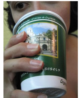
Fotografía 30 El Jarocho (Coyoacán)

Si se hace hincapié en la variedad de la comida mexicana, en los secretos que se esconden tras sus platillos, si frases como “se siente más cerca del relajo del puerto de Veracruz” o, en sentido contrario, “seriedad y estudio de la cocina mexicana”, están categorizando El país sin salir de la ciudad .