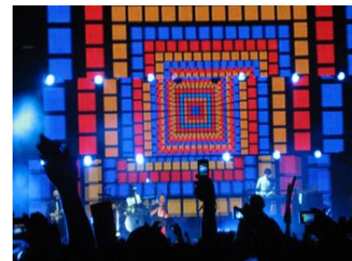
Fotografía 35 Entretenimiento en la metrópoli (Concierto de Café Tacuba)

puede ser un actor indiferente, hacerse el de oídos sordos y el de ojos ciegos ante los estímulos cambiantes que se dan en su realidad o jugar precisamente a vivenciar este cambio continuo; puede ser un actor anónimo, un actor perdido en el laberinto de cemento de la ciudad sin portar ningún tipo de rostro social, siendo uno más del fondo de la ciudad que recorre y sólo encuentra cierta presencia en los lugares que frecuenta; puede, por ese mismo anonimato, desear lo contrario, desear poner su rostro en la figura social, desear ponerse un sitio en su realidad; puede sentir una ligera aversión y una fuerte reserva exterior hacia los demás; si no fuera a través de esto, ¿cómo podría reaccionar ante esa desconfianza continua frente a los elementos que le rozan efímeramente en un ligero contacto? ¿Cómo desprenderse de ese ligero aletargamiento que le impone el hábito creado de haber nacido ya en una gran ciudad? Puede ser