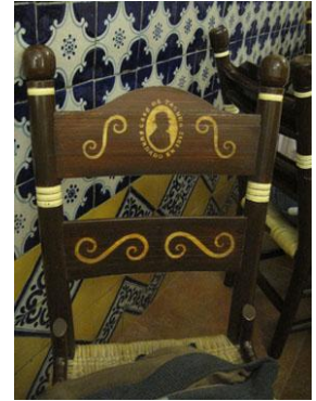
Fotografía 27 Café de Tacuba (Centro Histórico)

¿Hasta dónde refleja el sentir y el pensar de un habitante promedio del Distrito Federal? No importa, al menos para esta investigación, no interesa que no sea generalizable ni sea posible encontrar una media en su constitución, al fin y al cabo, ¿Acaso a la etnografía le interesa la generalización de la acción social? No, presenta en detalle el devenir de la acción. En este caso, asume como un todo el contenido de la guía y le comprende a través de ella. La guía necesita de un lector que le interprete, que le dé sentido a lo que se expresa a través de su forma y contenido; el intérprete, en esta ocasión, está situado desde la sociología cultural. 65 Las imágenes que muestran, los lugares que presentan, las formas como describen, los criterios que utilizan para clasificar, las maneras como organizan el contenido que presentan, son herramientas a través de las cuales se expresan los códigos y narrativas que constituyen su concepto y apuesta. 66