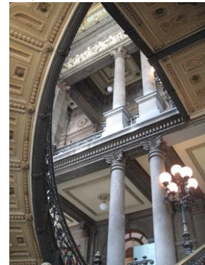
Fotografía 28 Museo Nacional de Arte (Centro Histórico)

"Eimbcke, Contreras, Gajá, Zabe y los Rovzar. Tanto talento local nos deja con ansia de más. La reinención del cine no sólo está en el brillo de sus autores y estrellas, sino en los recintos y festivales que lo enmarcan. No hay día en el que no se pueda descubrir algo diferente. Sólo hay que atreverse"(Editorial Mapas-Travesías, 2007:196).