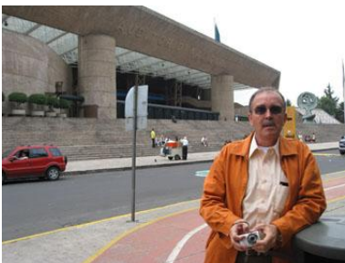
Fotografía 31 Auditorio Nacional (Paseo de la Reforma)

Quienes están permitidos es otra de las formas cómo se piensa al público, no todo el mundo es bienvenidos en todos lugares, hay públicos que son pensados según sean grupos familiares o personas solitarias. Hay “espacios dignos de ser disfrutados en