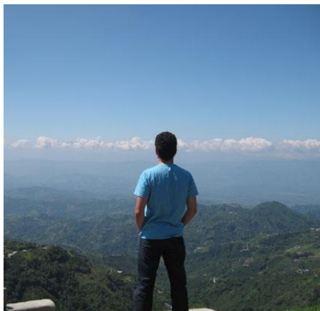
Fotografía 36 La no metrópolis (Chipre, Manizales, Colombia)

Las relaciones entre lo moderno y lo tradicional, lo exclusivo y lo excluido, lo nacional y lo cosmopolita se expresan en los conceptos que hacen los productores de lugar en la escena de consumo, cultura y entretenimiento de la Ciudad de México. Por tal razón, esta investigación decidió llegar a la zona sin una definición previa de lo que serían este tipo de relaciones para que, después de una prolongada inmersión en La Condesa, pudiera visibilizarse el significado que les atribuyen los productores de lugar a través de sus conceptos. Esta investigación apostó por este tipo de camino y encontró en la descripción de la acción de los actores el punto de partida en el acercamiento al campo. Haber esclarecido cuáles son las narrativas y los códigos que constituyen La Condesa fue el primer momento de una investigación que puede complejizarse si posteriormente se realiza un trabajo similar con las demás zonas caracterizadas por dF de Culto en la escena de consumo, entretenimiento y cultura en la Ciudad de México. Este ejercicio permitiría tener una imagen más completa de sus zonas y entender el porqué de su identidad como una ciudad atractiva y digna de ser recorridas por extranjeros y nacionales dentro del marco de los circuitos turísticos en el mundo entero.