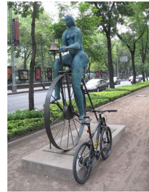
Fotografía 34 El aventurero (Paseo de la Reforma)

Se constituye, a su vez, en un nuevo productor de lugar, ordena y califica su producto de forma tal que, a partir de los contenidos reales en los que fundamenta su mirada y su juicio, crea una imagen que asemeja las veces de culto para los habitantes que están dispuestos a redescubrirla. La Ciudad de México deviene ciudad de culto cuando invitan a sus lectores a recorrerla tanto por los lugares de suma trascendencia histórica como de los espacios conocidos por unos pocos. Su concepto se define moderno, más cerca de lo fino, presenta la tradicional desde el gusto actual de tener un sentido de apreciación por el pasado; su concepto se define exclusivo, en detrimento de las apuestas que están fuera del sector de interés, una zona de clase media en la Ciudad