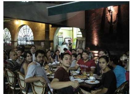
Fotografía 32 Coyoacán

En ocasiones, el valor del público está referido a su nacionalidad o condición de turista , los lugares se promocionan de muchísimas maneras, una de ellas permite “atraer turistas y a familias por igual”, en ocasiones, sin ser mexicano, se hace énfasis en la posibilidad que tendrían de sentirse de tal forma si el lugar sigue siendo visitados por ellos “Desde luego es preferido de turistas y familias de larga duración que se sienten más mexicanos”. La nacionalidad en ocasiones sirve como pivote central para el empuje del restaurante elegido; cuando son restaurantes mexicanos, “perfecto para que lleves esos amigos extranjeros con ganas de saber qué es eso”, cuando son de otras nacionalidades, la condición de extranjería, “el ambiente muy frecuentado por argentinos”, puede servir de garantía.