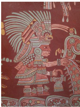
Fotografía 26 Museo Nacional de Antropología (Paseo de la Reforma)

La Condesa es una de las zonas que más concentra este tipo de pulso en la ciudad, al menos, desde la década de los 90's, sobre todo, en estos años del 2000, la actividad se ha intensificado. A manera de experimento podría abrirse dF de Culto y, en cualquiera de sus páginas, encontrar una referencia a la zona; La Condesa está en todos lados, siempre hay algo de ella en la guía, está en todas las secciones, ¿A qué se debe esto? La respuesta es concreta: La Condesa concentra gran parte del consumo en la ciudad. Sin