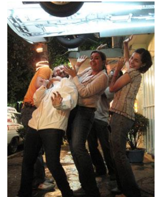
Fotografía 29 Recorridos en Condesa

También están los sitios a los cuales hay que haber ido para presumir de ellos, se presentan los artistas que están trazando el camino del arte en la ciudad, se proponen itinerarios para recorrer lo clásico, se descubren nuevas propuestas y se goza de las colecciones que se encuentran en los museos más protegidos en la ciudad. dF de Culto ilumina la variedad constante que se experimenta en la ciudad, no hay día en el que no se puede descubrir algo nuevo, algo diferente; todo tiene cabida en el gusto del espectador defebno. Hoja tras hoja, la oferta es infinita en Ciudad de México, se ocupa tanto de los templos de la buena vestimenta como de los bajo fondos? y el lujo más excitante que se encuentra en el gusto cosmopolita de sus habitantes. Necesitan perderse un momento de ella, para regresar tal cuales sujetos renovados y prodigios de la ciudad que les abraza en cuanto tal.