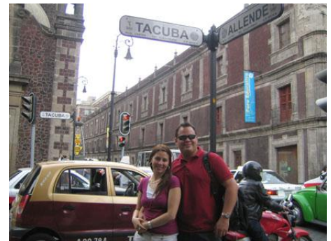
Fotografía 33 Centro Histórico

La carta de comidas es otro de los puntos donde se ponen en evidencia las narrativas más sobresalientes en los restaurantes. En esta ocasión, no sobresalen términos individuales para dar cuenta de ello, aparece cuando se califica de manera negativa el tipo de menú que se ofrecen: escuetos. Por el contrario, los calificativos vienen en frases con sentido completo. Si los calificativos son de aprobación, se habla reiteradamente de “cenas antológicas y elaboradísimas” en referencia a la cantidad de opciones que permite la carta, en otras ocasiones, si lo que se valora más es el modo de preparación de los alimentos que se ven expuestos en la carta, frase como “desayunos creativos, imaginativos y antológicos” está siempre dando vuelta entre sus páginas. En ocasiones, cuando el énfasis es puesto sobre el estilo de la carta, los términos aprobatorios más comunes para referirse son “limpias y sobrias”, de una manera u otra, a veces se acerca más a los significados de lo sencillo en contraposición a los menús demasiado elaborados. Finalmente, cuando es puesto en la expertiz que se traduce a través del contenido de la carta, tres frases resumen los calificativos más comunes utilizados para referirse a ello: “ejemplo de raíces revolucionadas”, “menú de respetables decisiones”, “mapa gastronómico del país”.