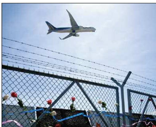
Save the Children

La presente edición del boletín AndinaMigrante se centra en el tema de las políticas de retorno, y su aplicación en Latinoamérica. En el dossier central presentamos un análisis comparativo entre las políticas de retorno implementadas por los principales países de destino de la migración internacional latinoamericana y por los países de la región que actualmente aplican este tipo de políticas. El análisis toma como marco la aprobación de la Directiva de Retorno y la actual crisis financiera global.