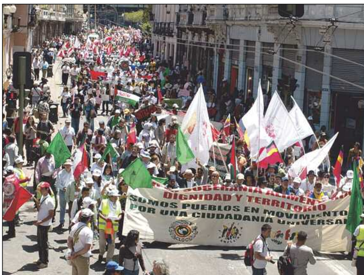
Save the Children

migrantes y hacer frente a las políticas migratorias existentes y sus contradicciones. Desde su punto de vista, una de las estrategias más importantes es el desarrollo de estructuras de coordinación que puedan unir, bajo un mismo propósito, a los migrantes con otros grupos que luchan por los derechos laborales y humanos.