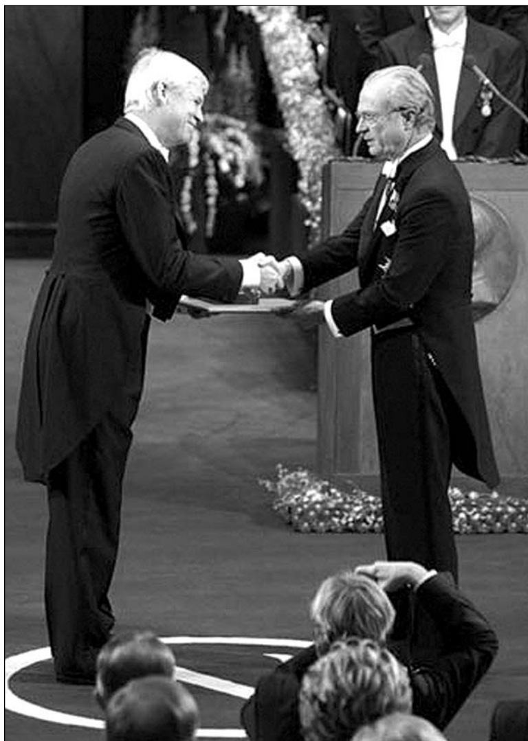
Robert Engle al recibir el nóbel de economía

Antes de abordar los temas relacionados a la vinculación entre modelos teóricos y modelos empíricos, cabe recordar que los fundadores de la Sociedad Econométrica Internacional fueron grandes economistas de la época: I. Fisher, J. Schumpeter, J.M. Keynes, entre otros. En su formación jugaron un papel importante las matemáticas y la estadística, al igual que en la de los miembros de la Cowles Commission de los años cuarenta y cincuenta del siglo XX; tal es el caso de T.C. Koopmans, J. Marschak y R. L. Klein. En estos últimos treinta años se ha profundizado la preparación matemática con respecto a aquella estadística, despertándose mayor interés por la modelística teórica respecto a aquella aplicada.