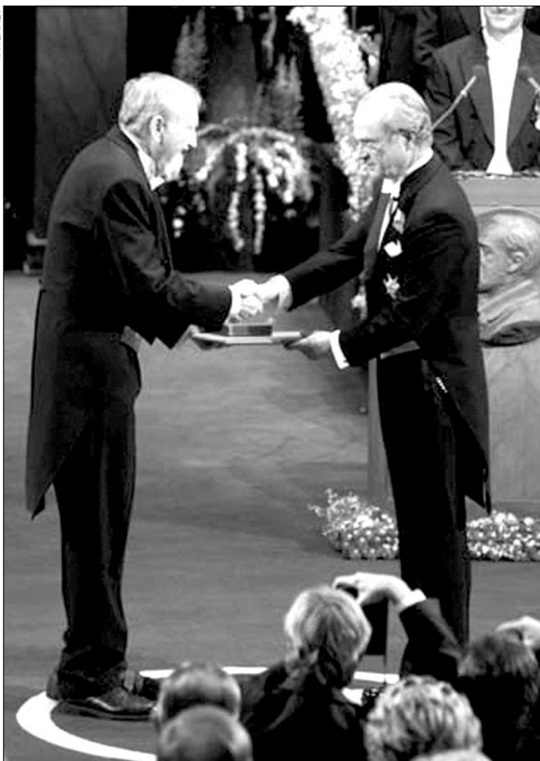
Clive Granger al recibir el n6bel de econom1a

En sntesis, y bajo determinadas condiciones, parecer1a factible someter a verificaci6n econom6trica algunas hip6tesis te6ricas, aunque evitando el mecanicismo consistente en la pretensi6n de medir una hip6tesis te6rica con los par6metros de una ecuaci6n estadística.