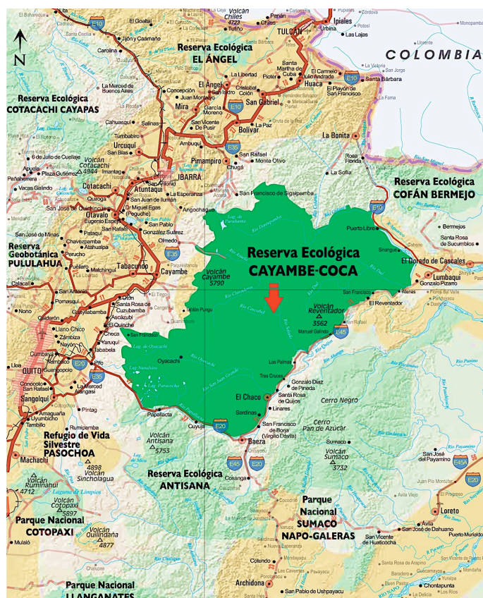
Figura 2 Mapa de Ubicación de Oyacachi dentro de la ex RECA, hoy Parque Nacional