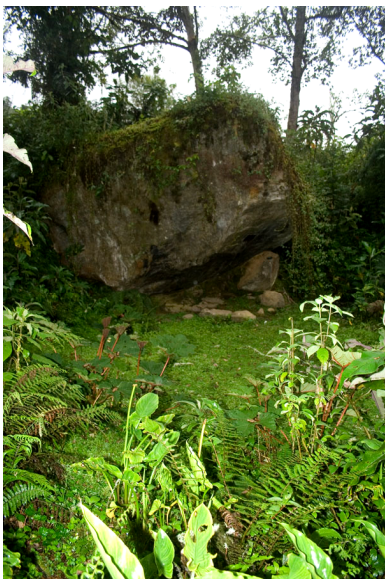
Piedra donde aparecía la Virgen

Los antecedentes que subyacen al origen de la figura tallada de la Virgen, pueden ser leídos desde la tradición oral, es decir la que mantiene la población de Oyacachi a través de leyendas y relatos; o desde la tradición escrita, que es la que corresponde a la de los cronistas