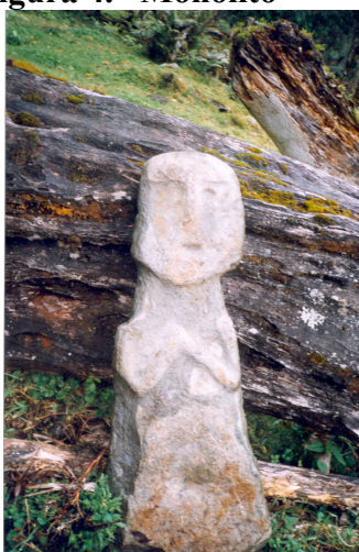
Figura 4. “Monolito”

Las memorias de la expedición realizada por Luciano Andrade Marín el 14 de marzo de 1944 permitieron tener información inédita sobre Oyacachi y su cultura (Khon, 2002). Según esas memorias, el asentamiento actual de la comuna es fruto de un peregrinaje por cuatro asentamientos importantes: Cedropamba , a 12 km. del pueblo actual; Mauca-llacta , “Pueblo Viejo” o “Tierra Antigua” ( Mauca : Antiguo, Llacta : Tierra), ubicado a 3 km. del lugar donde está hoy en día el pueblo y donde habitaron los antiguos pobladores de Oyacachi, de acuerdo a Andrade Marín (1952) hasta 1886, y según Males (1998) hasta el año de 1977. El tercer y cuarto asentamientos corresponden a la ubicación actual del centro poblado de Oyacachi, lo que se puede afirmar pese a que del tercer asentamiento no se tienen registro escritos, pero si se han encontrado restos de cerámica, objetos pétreos y fósiles humanos (Males, 1998).