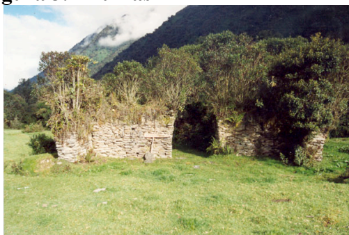
Figura 3. “Ruinas”