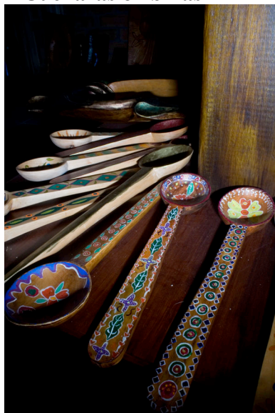
Artesanías turísticas: Cucharas o “billas”