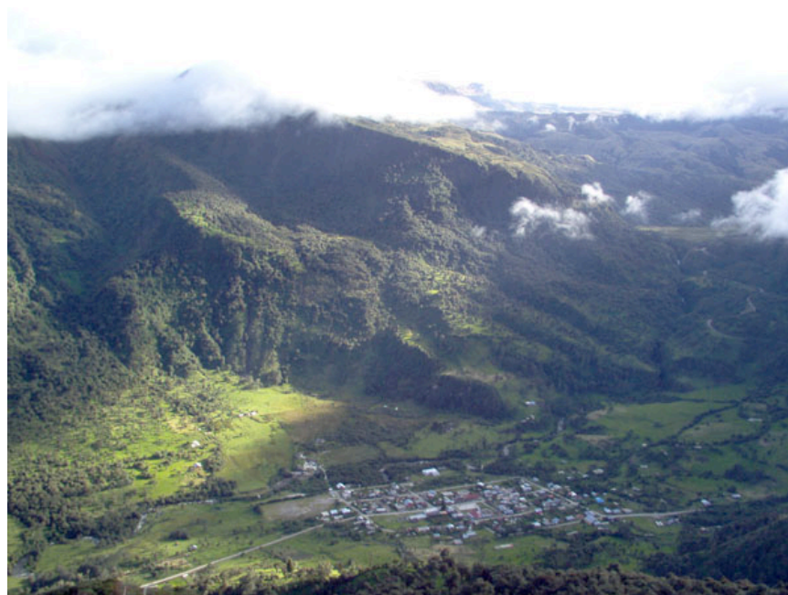
Figura 1. Oyacachi