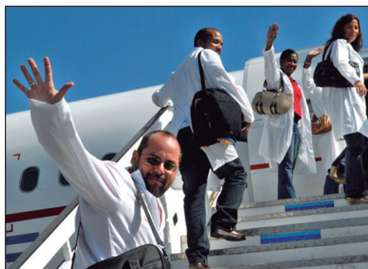
Médicos cubanos

En un diagnóstico realizado por Antonio Aja, sobre las tendencias de la emigración cubana entre el 2008 y el 2009, se preveían como principales destinos, junto a Estados Unidos y Europa, países de América del Sur, Centroamérica y el Caribe (Aja, 2006a). En esta misma línea, la Directora del CEMI, afirmó en una entrevista brindada a comienzos del 2013, que la migración cubana se está haciendo presente en Latinoamérica, no sólo en aquellas naciones con asentamientos históricos como México, Argentina o República Dominicana, sino que “en las últimas dos décadas también están Bolivia, Ecuador, Chile” ( El Comercio , 1ro abril 2013).