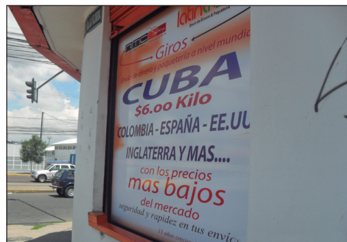
Barrio La Florida Quito-Ecuador

least one year, may be adjusted by the Attorney General, in his discretion and under such regulations as he may prescribe, to that of an alien lawfully admitted for permanent residence if the alien makes an application for such adjustment, and the alien is eligible to receive an immigrant visa and is admissible to the United States for permanent residence. (...)” Este trato diferenciado incluye una ayuda provisional que implica la entrega mensual de $180 dólares en efectivo y $200 dólares en alimento, hasta que el inmigrante se vincule laboralmente.