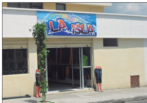
Negocio Barrio La Florida-Quito

Lo interesante de El Paraíso, por su parte, es que este no es concebido, ni por la población guayaquileña en general ni por la población cubana en particular, como un barrio cubano, y no se encuen-