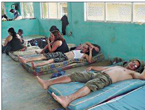
Migrantes cubanos detenidos en Panamá

En sentido general puede afirmarse que “las posibilidades de legalización de la migración cubana en Ecuador se han visto reducidas debido a factores diversos” como la “limitación a la tramitación de cartas de invitación mediante una suerte de concordato silencioso entre los notarios”, “la impugnación de matrimonios con la correspondiente encarcelación de funcionarios públicos”, “el establecimiento de requisitos por parte de las agencias de comercialización de los boletos de viaje”, así como la existencia de limitaciones administrativas para acceder a alguna visa (Correa, 2013: 66).