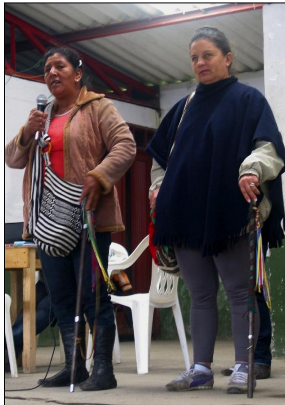
Imagen . Autoridades en la asamblea nacional de mujeres indígenas

Autoridades en la asamblea nacional de mujeres indígenas 2012