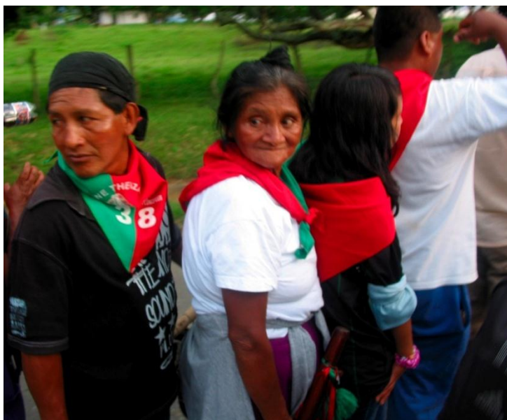
Guardias en la marcha de las antorchas 2012.