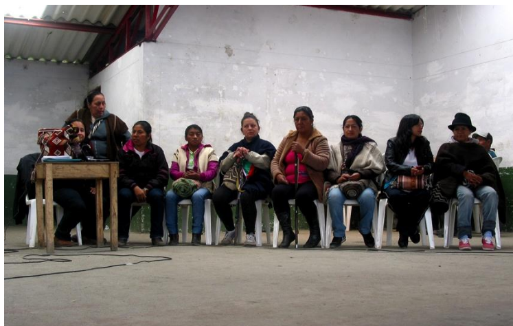
Imagen10. Mujeres lideresas de diferentes resguardos

Mujeres lideresas de los diferentes resguardos en la asamblea nacional de mujeres abril 2012