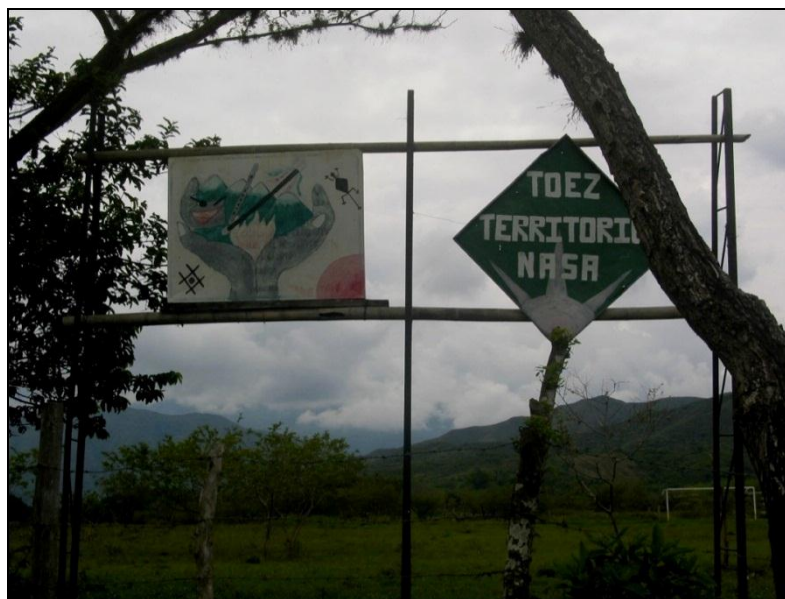
Entrada al resguardo de Tóez, Caloto, Cauca- Colombia. 2012.