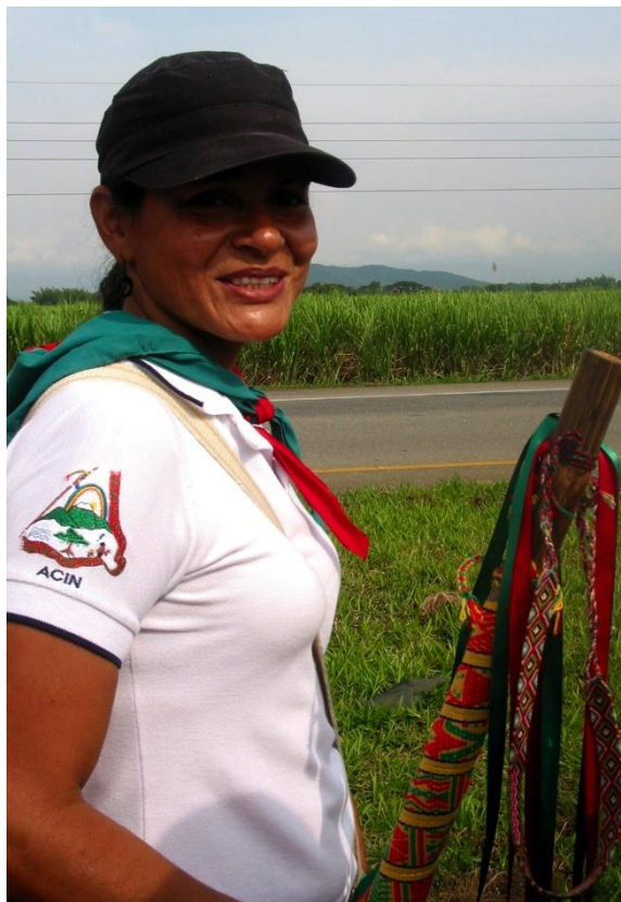
Imagen 12. Guardia con su bastón

Guardia con su bastón en la marcha de las antorchas, Cauca. Colombia 2012