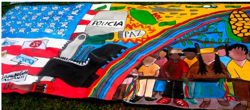
Imagen 7. Pancarta expuesta en la marcha de las antorchas

Pancarta presentada en la marcha de las antorchas. Cauca. Colombia. 2012