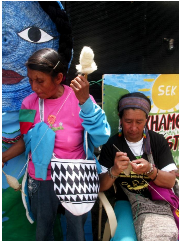
Imagen 11. Mujeres Nasa hilando y tejiendo mochilas durante una

Mujeres Nasa hilando y tejiendo mochilas durante una concentración de la marcha de las antorchas 2012