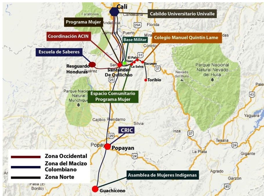
Imagen 2: mapa de los recorridos

Mapa de las zonas visitadas y ubicación de los sitios de investigación 2012.