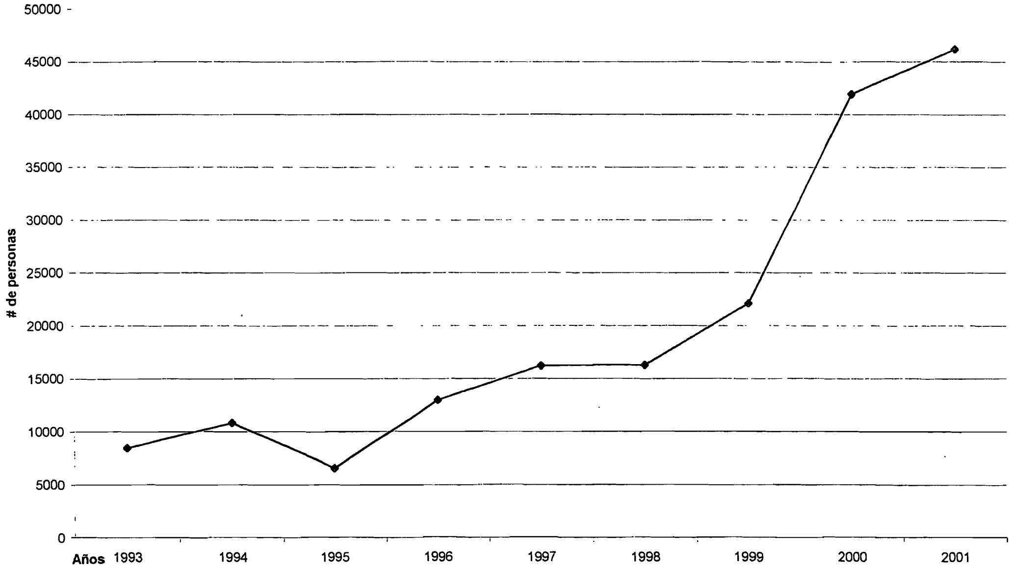
Salida de ecuatorianos a Perú 1993 - 2001