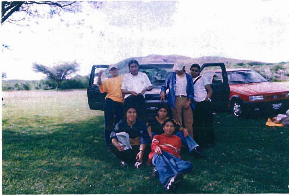
Grupo de muchachos de la comunidad de Peguche junto a sus automóviles. Un fin de semana de descanso.