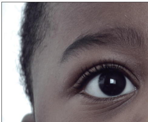
Niño ecuatoriano de padres haitianos.

En el presente boletín, Iréri Ceja analiza la migración haitiana y ubica a la región andina no solo como región de tránsito sino también como un nuevo destino, particularmente para el caso ecuatoriano. Este análisis parte situando históricamente algunos procesos político económicos, tales como las configuraciones coloniales y el intervencionismo extranjero en Haití, que condicionaron el desarrollo del país y detonaron los procesos migratorios. Posteriormente, para ubicar el análisis en la actualidad se retoma el impacto que tuvo en