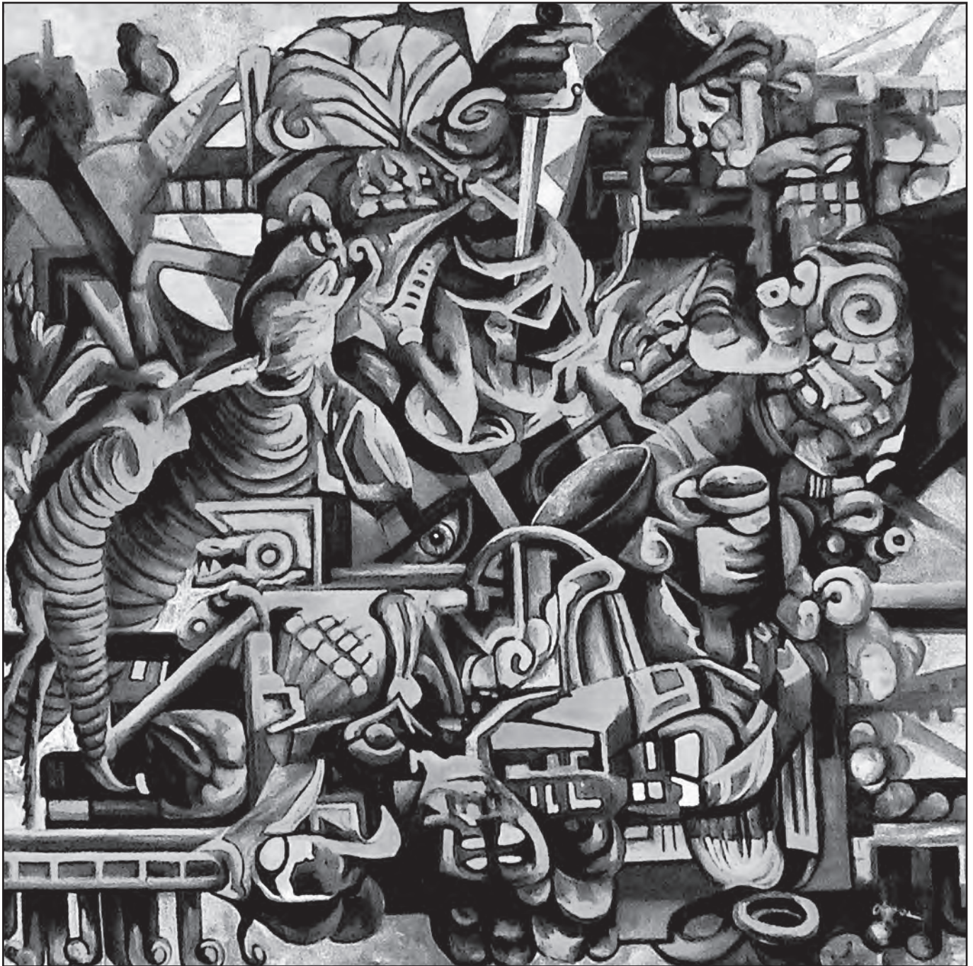
Sergio Elizea, La máscara de la política , 2006.