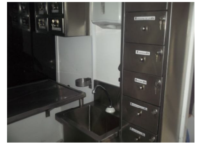
Interior Unidad móvil de esterilizaciones. Universidad CES. Trabajo de campo, Medellín 2012.