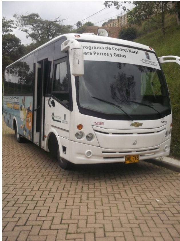
Unidad móvil de esterilizaciones. Universidad CES. Trabajo de campo, Medellín 2012.