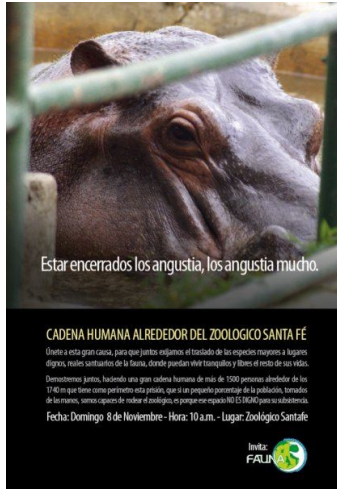
Campaña por el traslado de Vera del zoológico Santa Fé a la Hacienda Nápoles. Año 2009, Medellín.