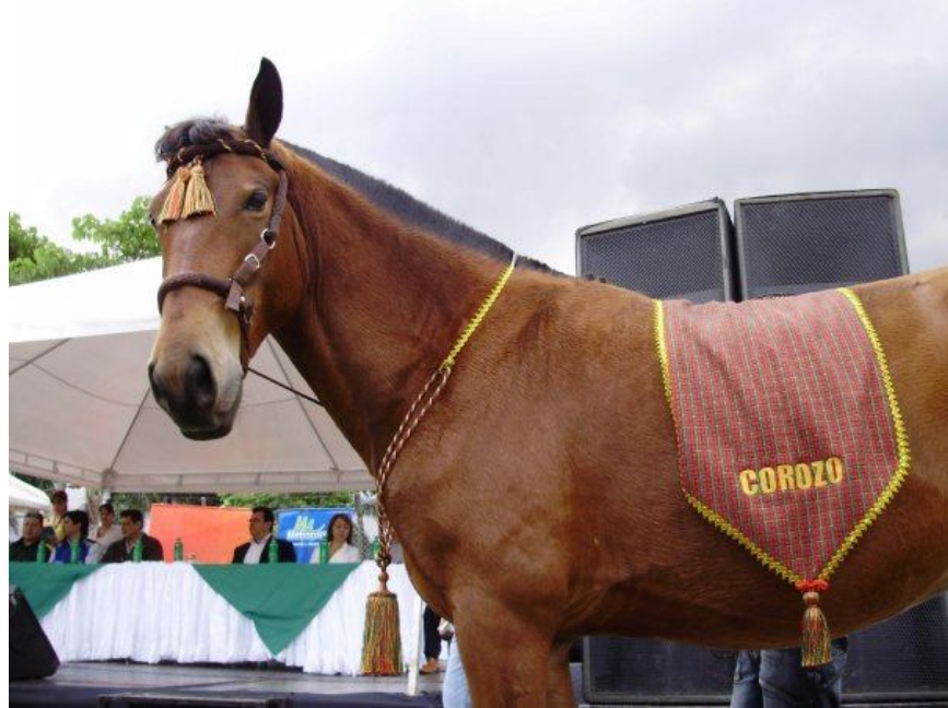
"Corozo" Caballo ex carretillero recuperado totalmente y disfrutando de un feliz hogar. Diciembre 2009, Medellín.