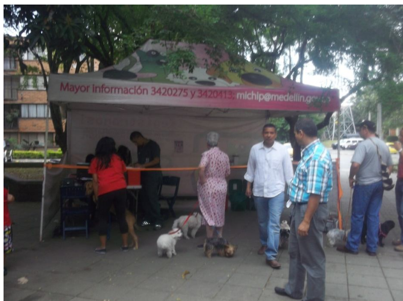
Fuente: Autora. Campaña Móvil Mi-Chip, trabajo de campo, Medellín 2012