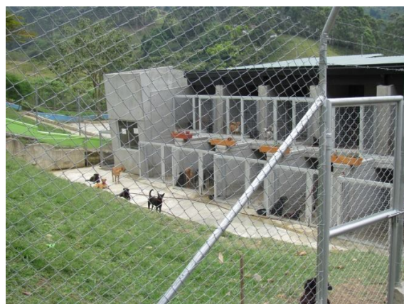
Interior Centro de Bienestar La Perla, trabajo de campo, Medellín 2012