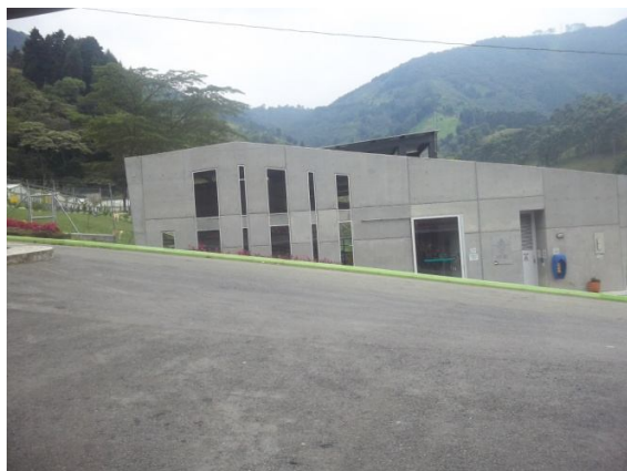
Interior Centro de Bienestar La Perla, trabajo de campo, Medellín 2012