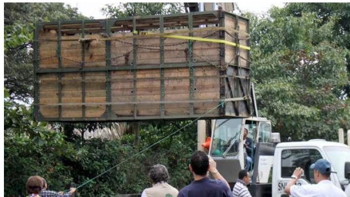
Gigante operativo para el traslado de Vera, Medellín 25/08/2011