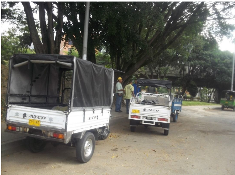
Medellín libre de Vehículos de Tracción Animal, trabajo de campo, año 2012, Medellín – Colombia