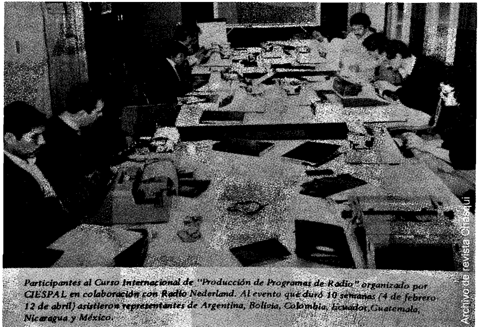
Participantes al Curso Internacional de "Producción de Programas de Radio" organizado por CIESPAL en colaboración con Radio Netherland. Al evento que duró 10 semanas (4 de febrero 12 de abril) asistieron representantes de Argentina, Bolivia, Colombia, Ecuador, Guatemala, Nicaragua y México.

Los conocimientos adquiridos fueron replicados en varios seminarios a los que asistí en calidad de conferencista y sobre todo en la Educación Superior en la Universidad Privada de Santa Cruz de la Sierra (UPSA), en donde fue catedrático titular por más de 10 años. Allí dicté las materias "Fundamentos de Radiodifusión" y "Taller de Programas de radio",