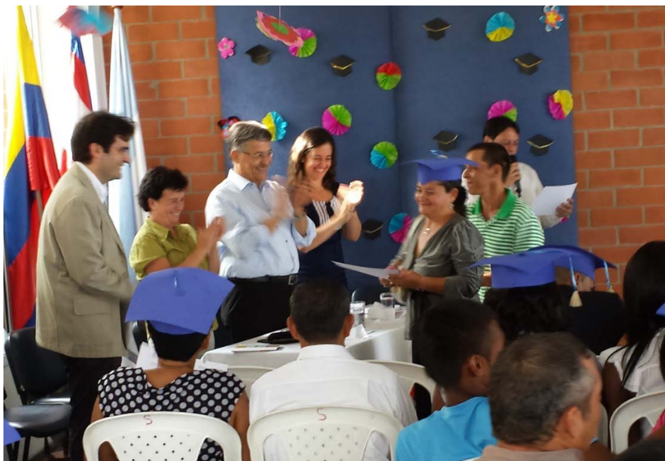
Fotografía 5. Graduación de Líderes en el componente de fortalecimiento comunitario y social. 2014