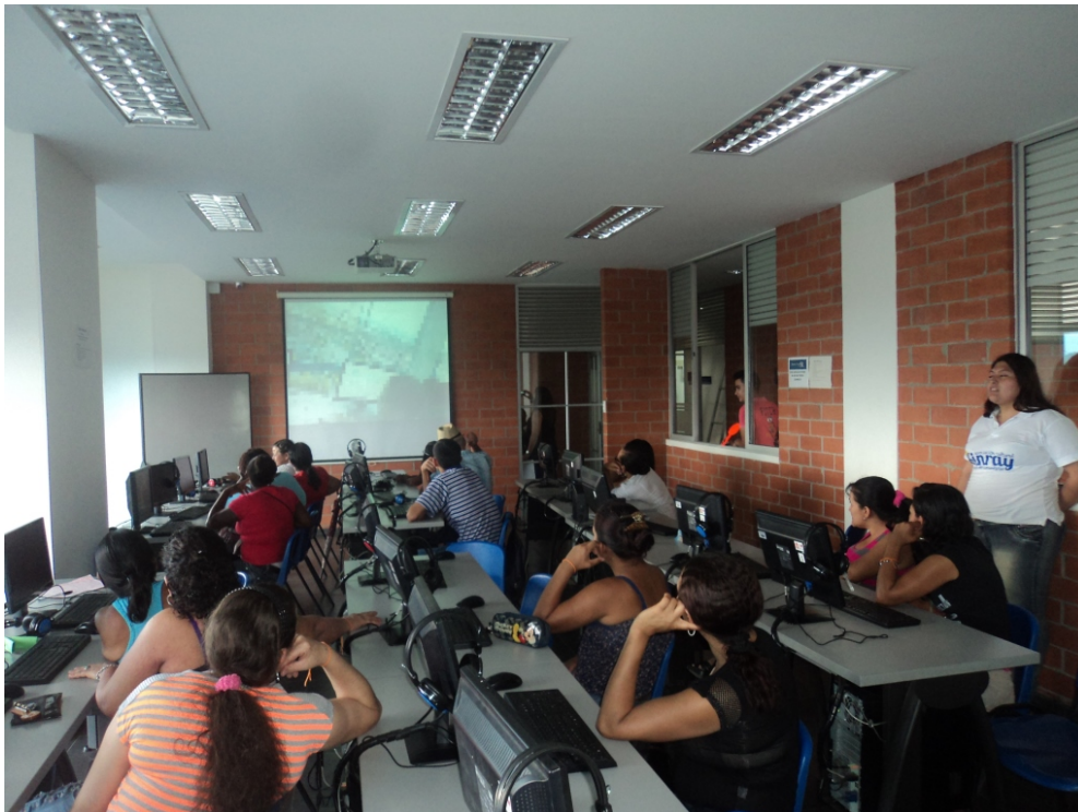
Fotografía 2. Ambiente de Capacitación con beneficiarios para el mejoramiento de competencias básicas y de modernidad. 2013