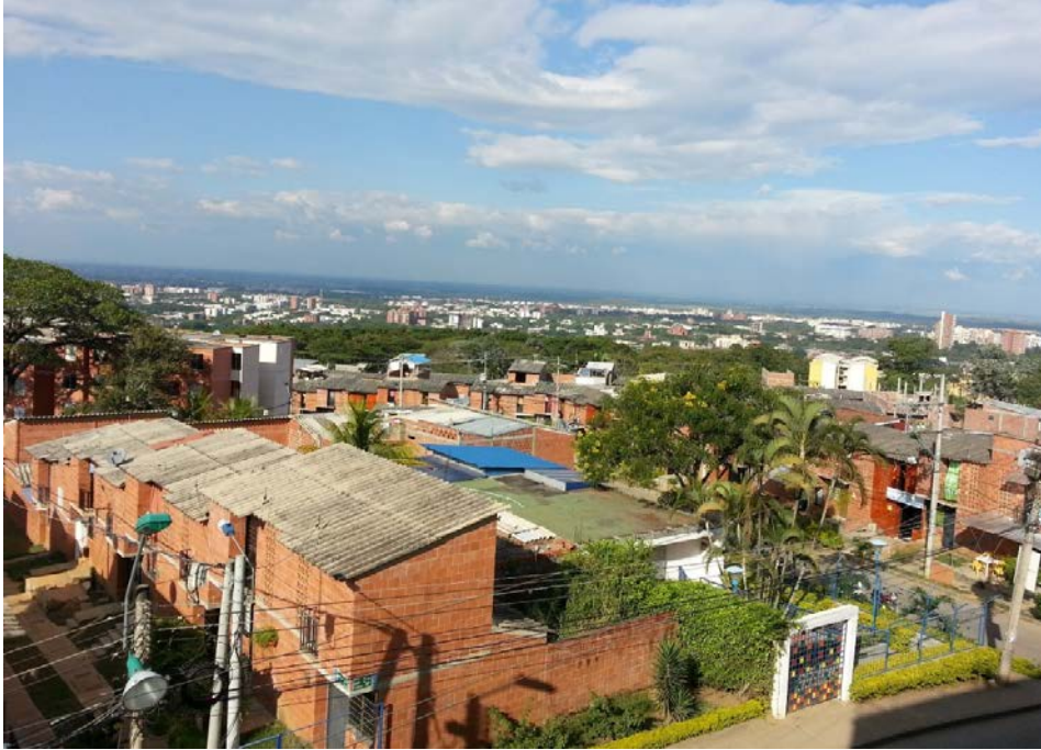
Fotografía 1. Entorno de la comuna-18 desde el Centro Comunitario de la Fundación Carvajal. Al fondo sur de Cali. 2013