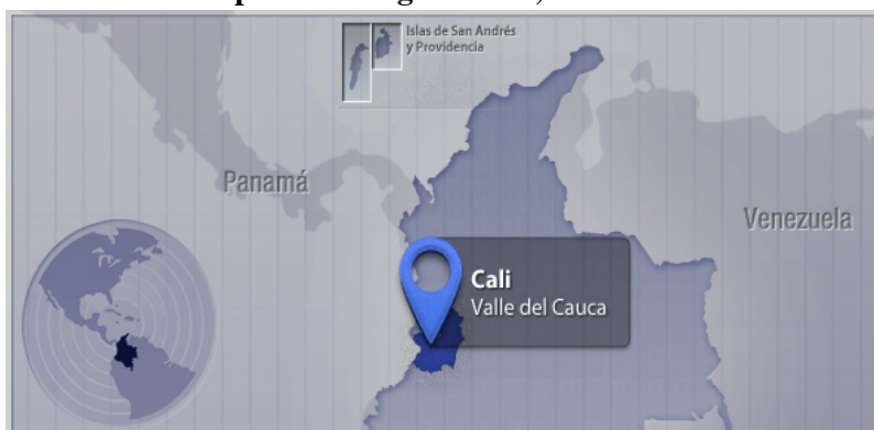
Mapa 1. Santiago de Cali, Colombia

Santiago de Cali, también conocida como Cali, es la capital del departamento del Valle del Cauca y la tercera ciudad más importante de Colombia. Desde mediados del siglo XX ha transformado su entorno metropolitano en el principal centro industrial, comercial y financiero al ser el principal destino de las migraciones de todo el suroccidente colombiano (Posso, 2008). Se divide política y administrativamente en 22 comunas y, según proyecciones, cuenta en 2014 con una población total de 2.344.703 habitantes (Alcaldía de Santiago de Cali, 2013). Según el PNUD (2008), Cali exhibía indicadores que la ubicaban entre las ciudades de Colombia con mejores logros económicos y sociales. Para el 2005, según la misma fuente, el Índice de Desarrollo Humano de la capital vallecaucana (0,802) era ligeramente inferior al de Bogotá (0,83). Para 2005, las necesidades básicas insatisfechas eran inferiores a las de Medellín (12,42) y menos de la mitad de las de la nación (27,6). En materia económica, la tasa de desempleo se redujo en un punto porcentual, pasando de 11,9 en el 2005 a 10,9 en el 2007; sin embargo, la ciudad seguía en deuda en materia de mejores condiciones de vida para sus habitantes (Alcaldía de Santiago de Cali, 2008).