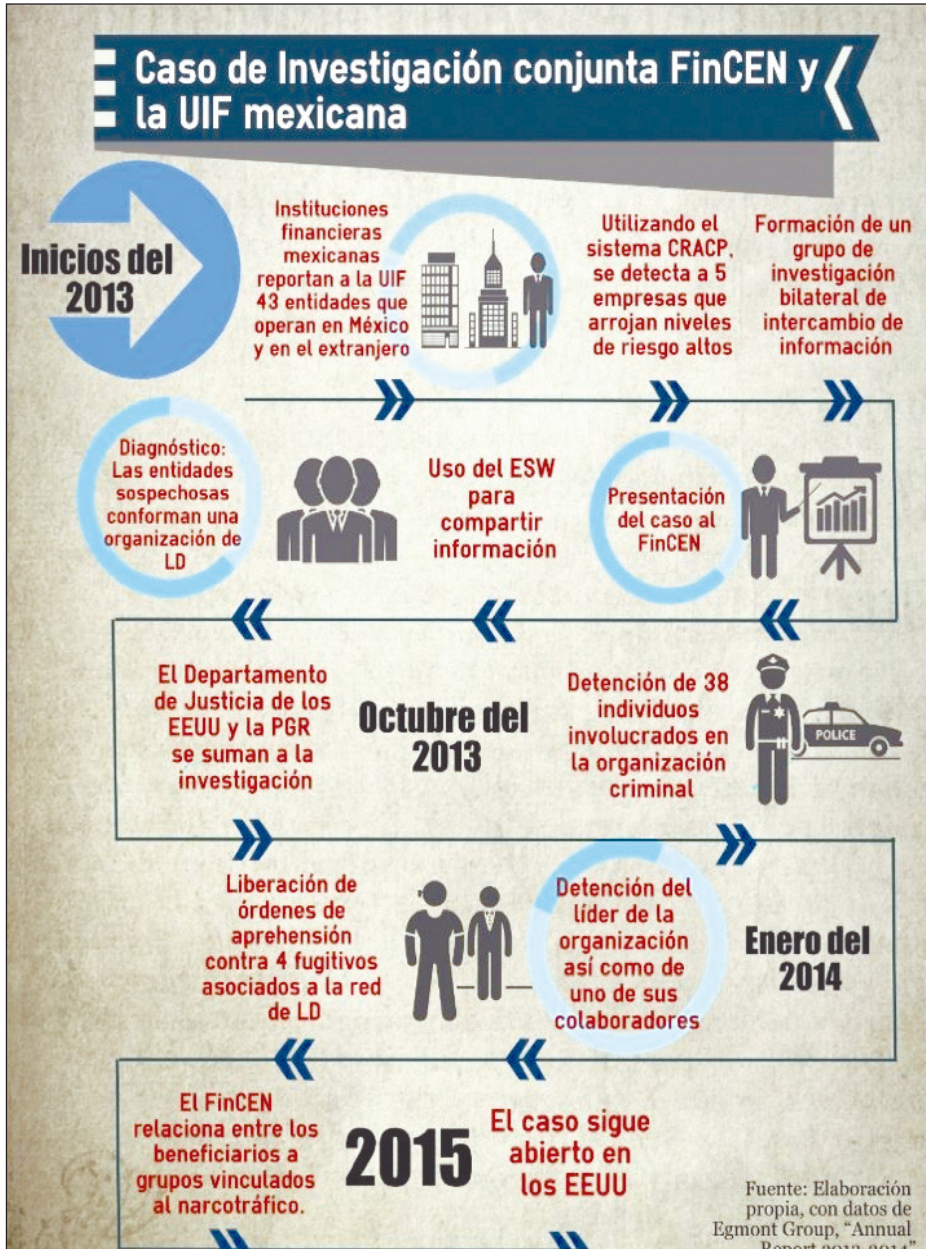
Gráfico 2. Investigación conjunta FinCEN y la UIF mexicana

Nota: Programa Computarizado de Análisis de Alto Riesgo (CRACP), Egmont Secure Web (EGW) Plataforma de internet desarrollada para el intercambio seguro de información entre las UIF, Procuraduría General de la República (PGR), Financial Crimes Enforcement Network (FinCEN), Unidad de Inteligencia Financiera (UIF), lavado de dinero (LD).