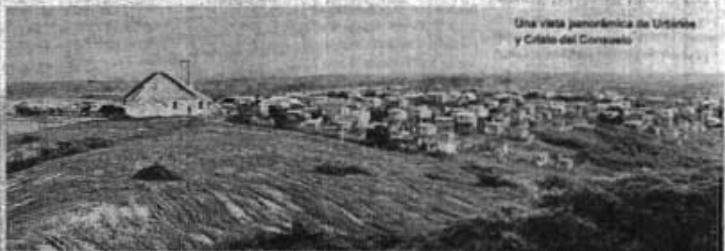
Una vista panorámica de Urbino y Cristo del Consuelo

que de esta manera estaremos previniendo la escasez del líquido vital a falta de una infraestructura adecuada.