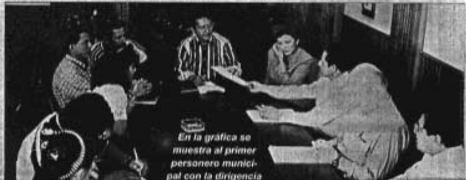
En la grafica se muestra al primer personero municipal con la dirigencia

El Alcalde y su Cuadro edilicio siempre han brindado esta apertura para canalizar las peticiones de los barrios, asimismo, pidió a la U. B. M. que organice a las bases para que de esta manera se actúe más ágiles en la obra pública y se evite contratiempos y malas interpretaciones. De la misma forma abrió un espacio para que los moradores brinden con información abierta sobre lo que pasa en el "City" municipal.