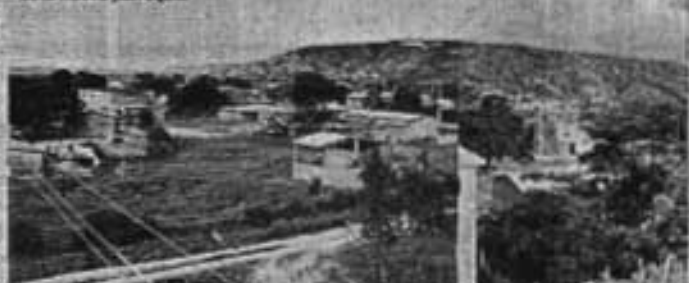
San Juan también formará parte de la nueva parroquia

riendo desde Rocafuerte atraviese la vía Circunvalación hasta la parroquia de San Mateo, adelantándose al futuro, ya