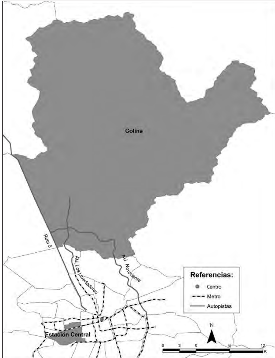
Mapa 2. Ubicación general: casos Estación Central y Colina

Elaboración propia con base en datos del Instituto Geográfico Militar.