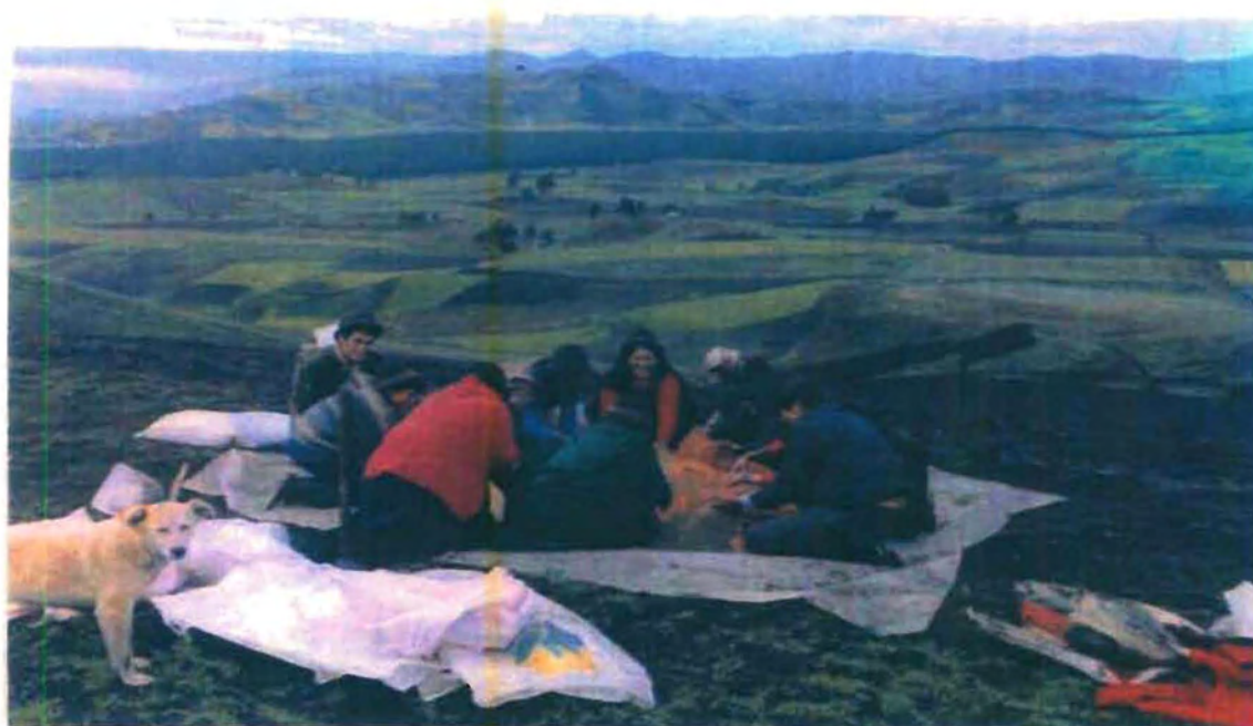
(FOTO) GRUPO DE INTEGRANTES DE UNA COMUNIDAD DE GUANO EN LABORES AGRÍCOLAS

El antropólogo mexicano H. Díaz (1977), señala que las unidades económicas campesinas están organizadas en función de la producción para satisfacer las necesidades de la familia y la unidad de producción.